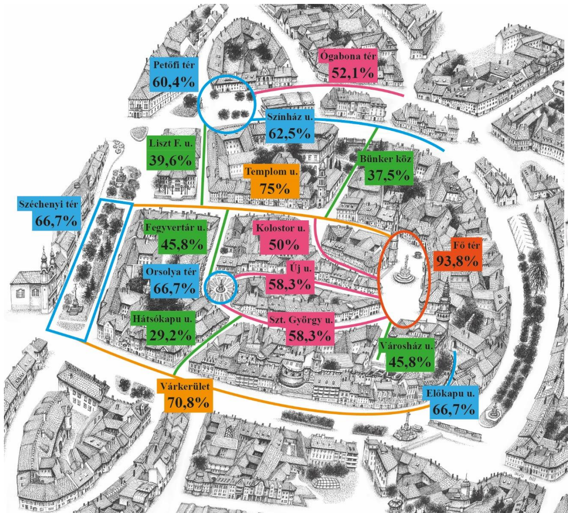
1. ábra: A turisztikai attrakciók látogatottság szerinti megoszlása (%)