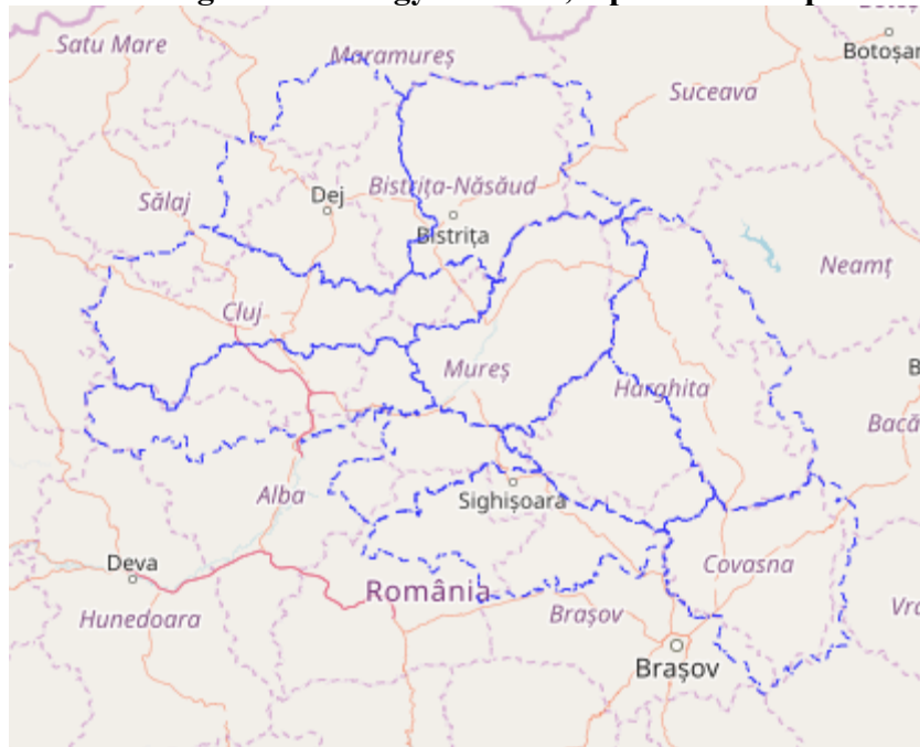
2. ábra: A feldolgozott vármegyehatárok, OpenStreetMaps háttérrel

nagyítási szint: 8 – lépték: 1:2.000.000