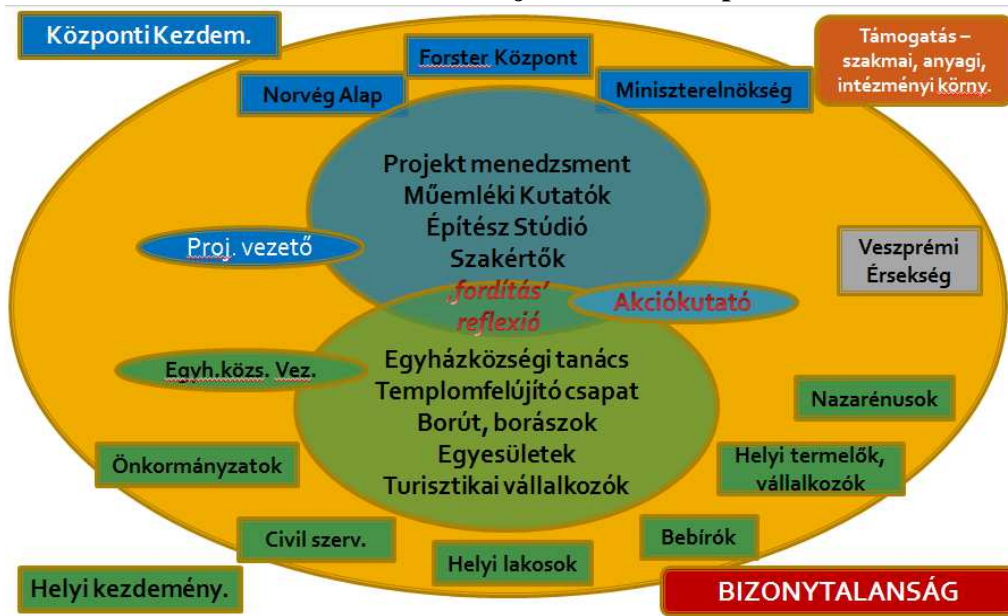
1. ábra: A felújítás főbb szereplői