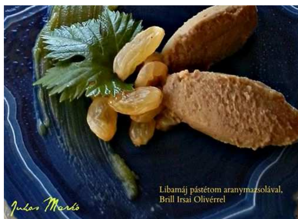
2. fotó: Libamáj pástétom arany mazsolával, Brill irsai olivér szőlőpálinkával