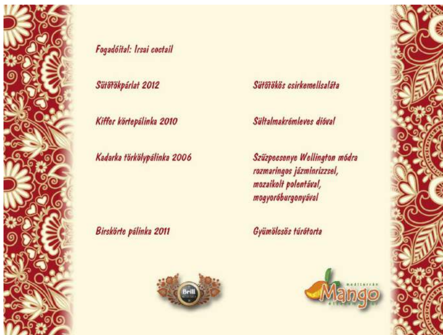
2. ábra: Pálinka vacsora a szekszárdi Mangó étteremben