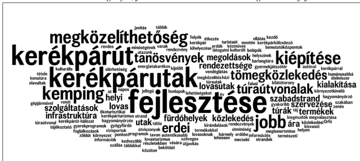
2. ábra: A válaszadók igényei, javaslatai az ökoturisztikai szolgáltatások fejlesztésére.

A kutatás azt is felmérte, hogy a vendégkör milyen szolgáltatások fejlesztését látná szívesen a térség ökoturizmusában. A megkérdezett 199 fő közül 73 élt a lehetőséggel, hogy megfogalmazza elvárásait. A beérkezett válaszokból szófelhőt alkottunk (2. ábra). A szófelhőben a szavak nagysága az említések gyakoriságát jelzi, ám az egymás mellé kerülő szavak nem mutatnak egymással összefüggést.