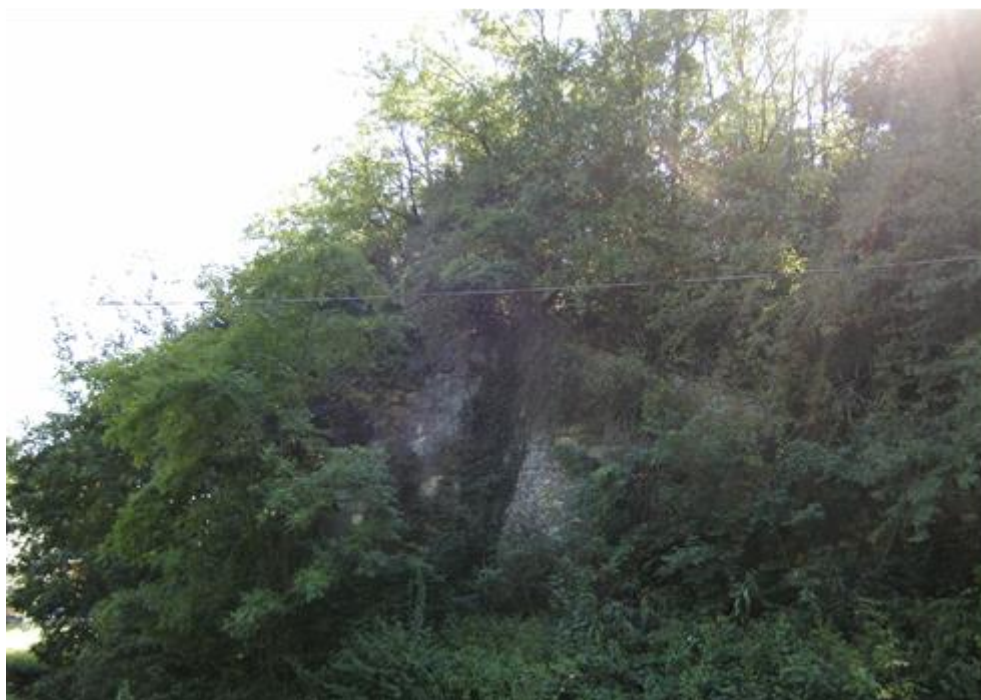
Fotó: Bércesi Richárd, 2011.

Bánom, Pécsbányatelepi vasút, András-akna iparvágány