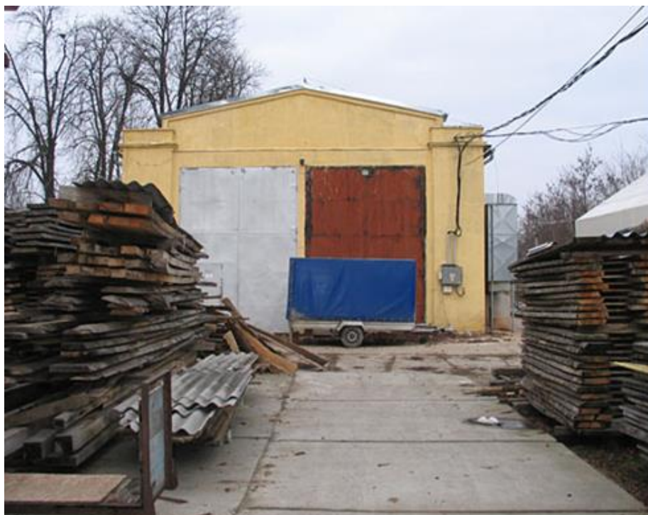
Fotó: Löffler Péter, 2008. A Pécsi Bányásztörténeti Alapítvány hagyatéka, Janus Pannonius Múzeum Pécsi Várostitörténeti Múzeum