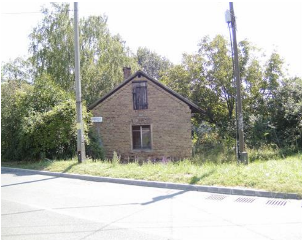
Fotó: Bércesi Richárd, 2010.