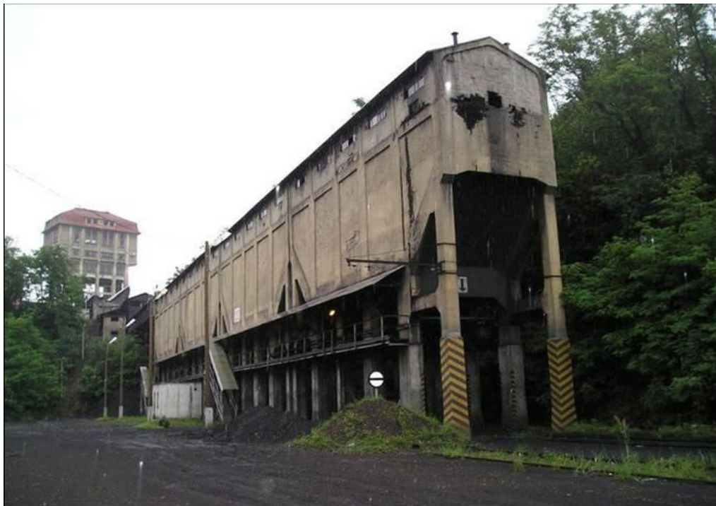
Fotó: Uherkovich Péter, 2004. Uherkovich Péter magángyűjteménye

Pécsbányatelep, Gróf Széchenyi István-akna, vasútállomás