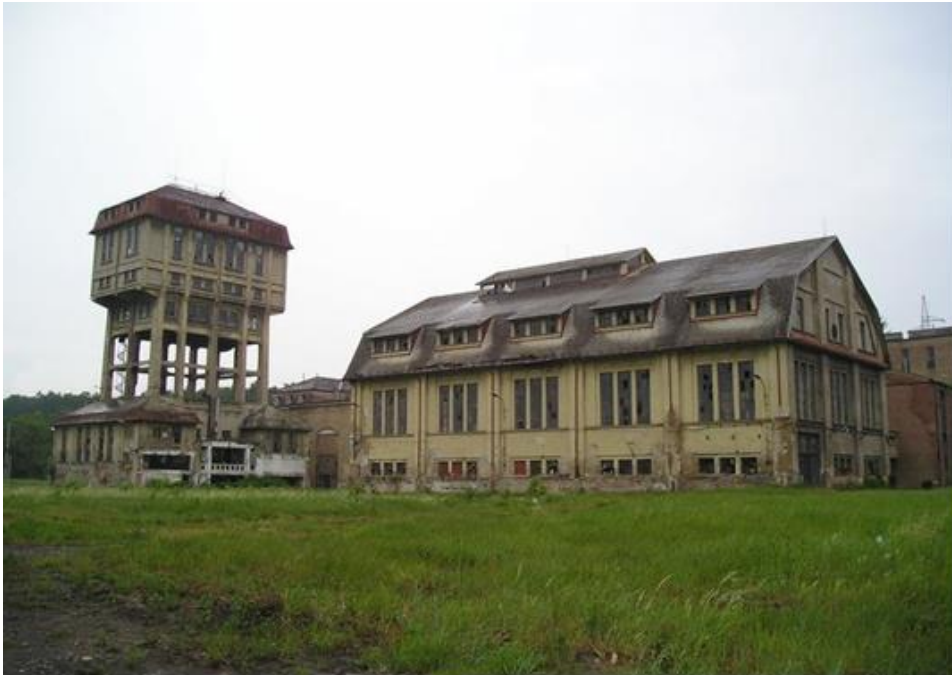
Fotó: Löffler Péter, 2015. A Pécsi Bányásztörténeti Alapítvány hagyatéka, Janus Pannonius Múzeum Pécsi Várostörténeti Múzeum