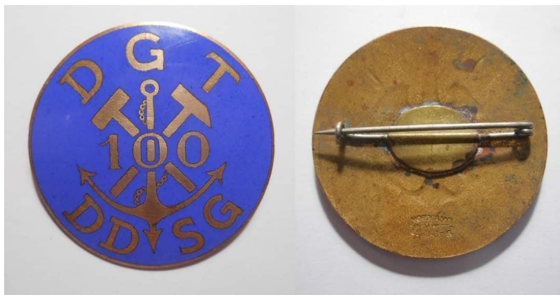
A Pécsi Bányásztörténeti Alapítvány hagyatéka, Janus Pannonius Múzeum Pécsi Várostarténeti Múzeum