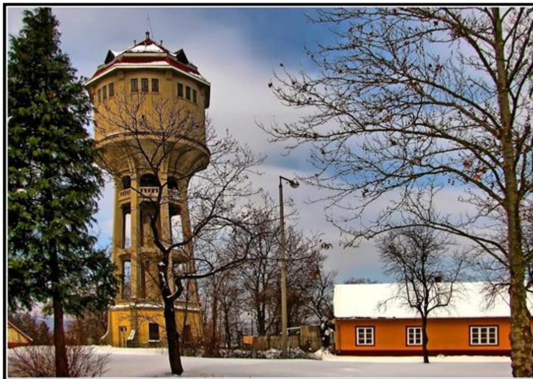
Fotó: Löffler Péter, 2008. A Pécsi Bányásztörténeti Alapítvány hagyatéka, Janus Pannonius Múzeum Pécsi Vároštörténeti Múzeum