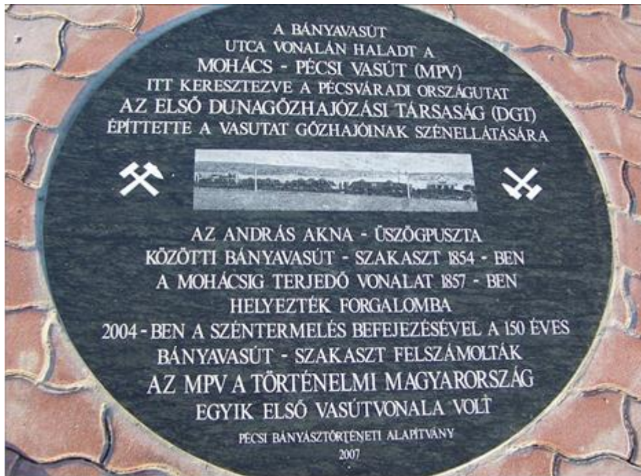
2012. március 1