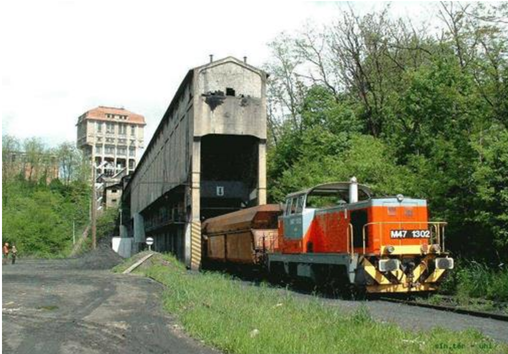
Fotó: Uherkovich Péter, 2004. Uherkovich Péter magángyűjteménye

Pécsbányatelep, Gróf Széchenyi István-akna, vasútállomás