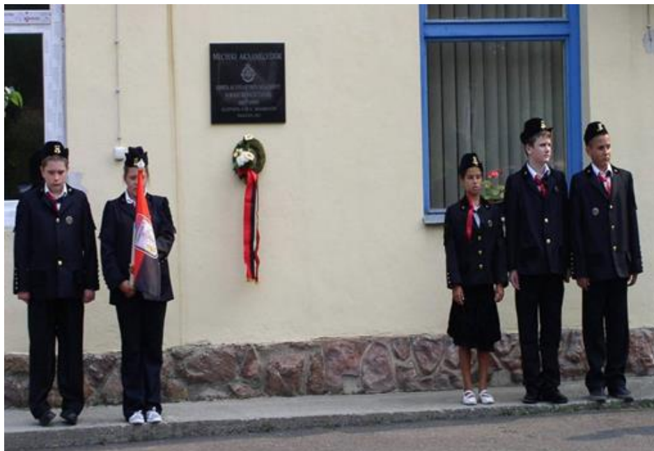
Fotó: Löffler Péter, 2017. A Pécsi Bányásztörténeti Alapítvány hagyatéka, Janus Pannonius Múzeum Pécsi Várostarténeti Múzeum