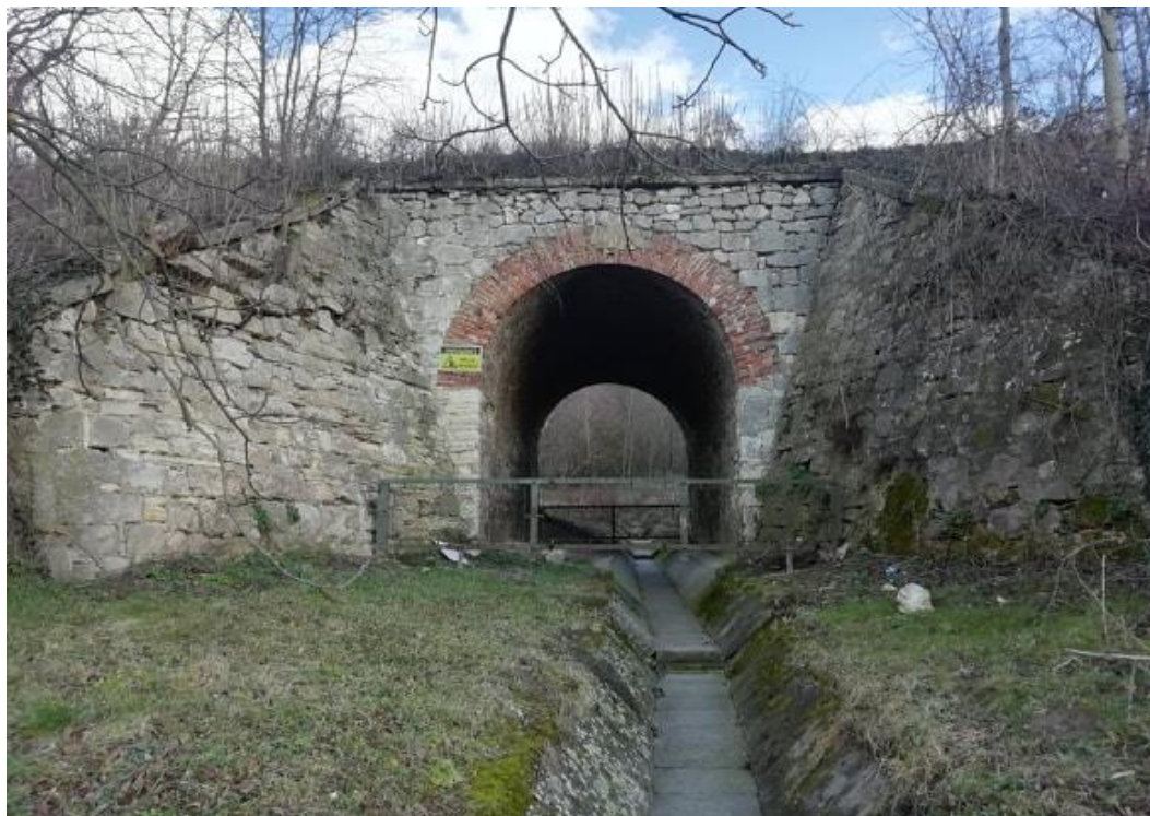
Fotó: Bércesi Richárd, 2020.