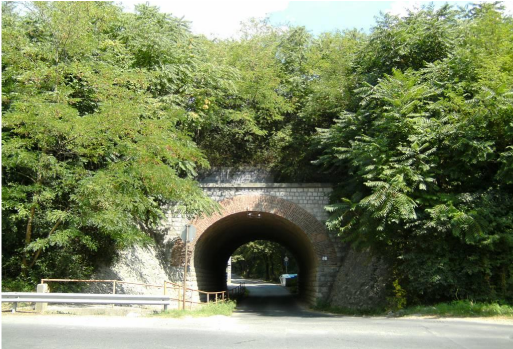
Fotó: Bércesi Richárd, 2011.

Bánom, Pécsi Bányavasutak, Pécsbányatelepi vasút, Széchenyi-akna iparvágány