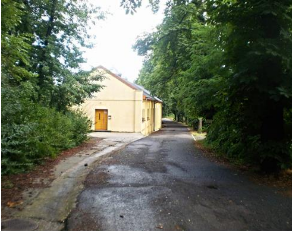
Fotó: Bércesi Richárd, 2014.