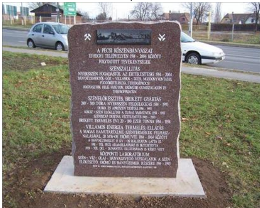
Fotó: Bércesi Richárd, 2012.