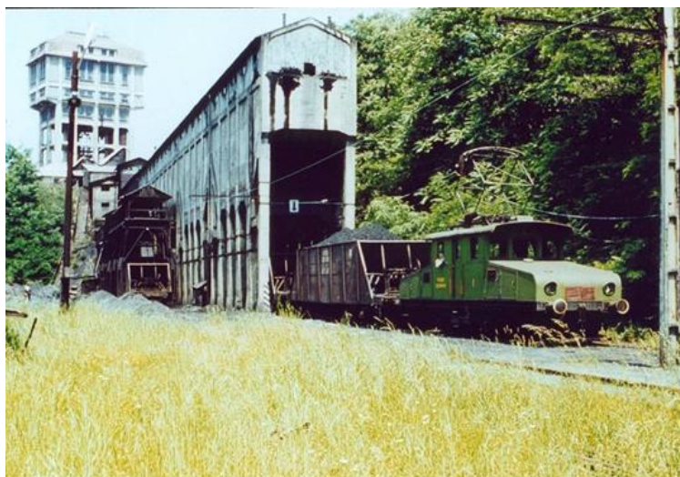
Fotó: Lakos Rudolf, 1978. Lakos Rudolf magángyűjteménye

Pécsbányatelep, Gróf Széchenyi István-akna, vasútállomás