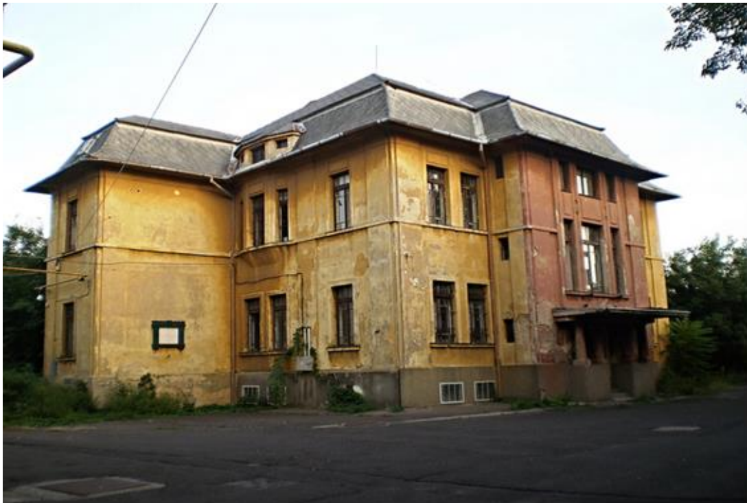
Fotó: Löffler Péter, 2017. A Pécsi Bányásztörténeti Alapítvány hagyatéka, Janus Pannonius Múzeum Pécsi Várostörténeti Múzeum