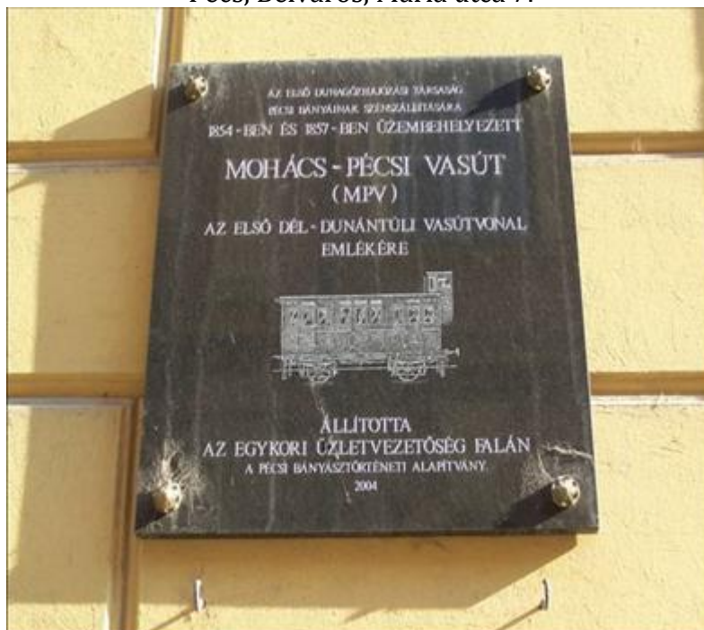
Fotó: Bércesi Richárd, 2012