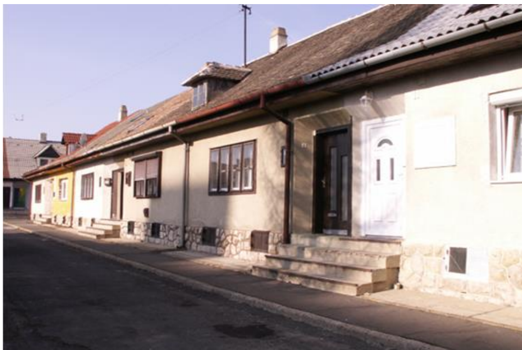
Fotó: Löffler Péter, 2017. A Pécsi Bányásztörténeti Alapítvány hagyatéka, Janus Pannonius Múzeum Pécsi Vároštörténeti Múzeum