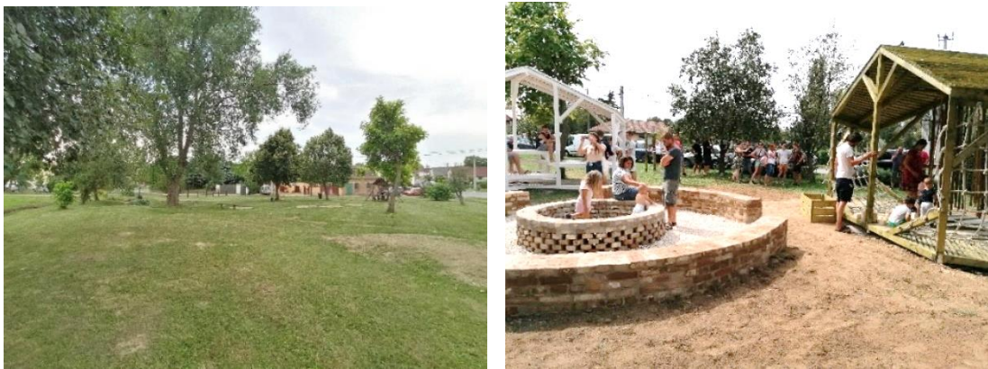
1. ábra: Az építési helyszín eredeti állapotában és az új közösségi tér Martonfán

Martonfán egy nagy tűzrakóhely köré három különböző korosztály igényeire reflektáló pavilonok épültek: a legfiatalabbakat függesztett bambuszerdős, fa építőjáték és kötélmászókás kuckó, a kamaszokat „csillagnéző” pihenő, a felnőtteket kártyapartikra is alkalmas fedett kiülő várja. A település 230 lakosának egyharmada vett részt közvetlenül a tervező- és építőmunkában. A helyszínen az átadás óta több közösségi esemény, kulturális program és ez év tavaszától helyi termék vásárok kerültek megrendezésre.