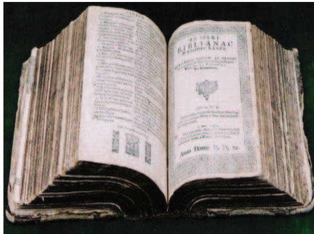
6. ábra Károli Gáspár vizsolyi Bibliája

A hajdú-identitás másik nagy támasza a reformált egyház kálvini változata. 1536-ban János király enyingi Török Bálintnak adományozta a debreceni uradalmat, aki 16 esztendő alatt egyeduralkodóvá tette Debrecenben a kálvinista egyházat, s ez így maradt egészen 1715-ig, a város méltán nevezetett Helveticae Confessionis addictissimanak, mert még szolgának és cselédnek sem tűrt meg kebelében katolikust.” 12