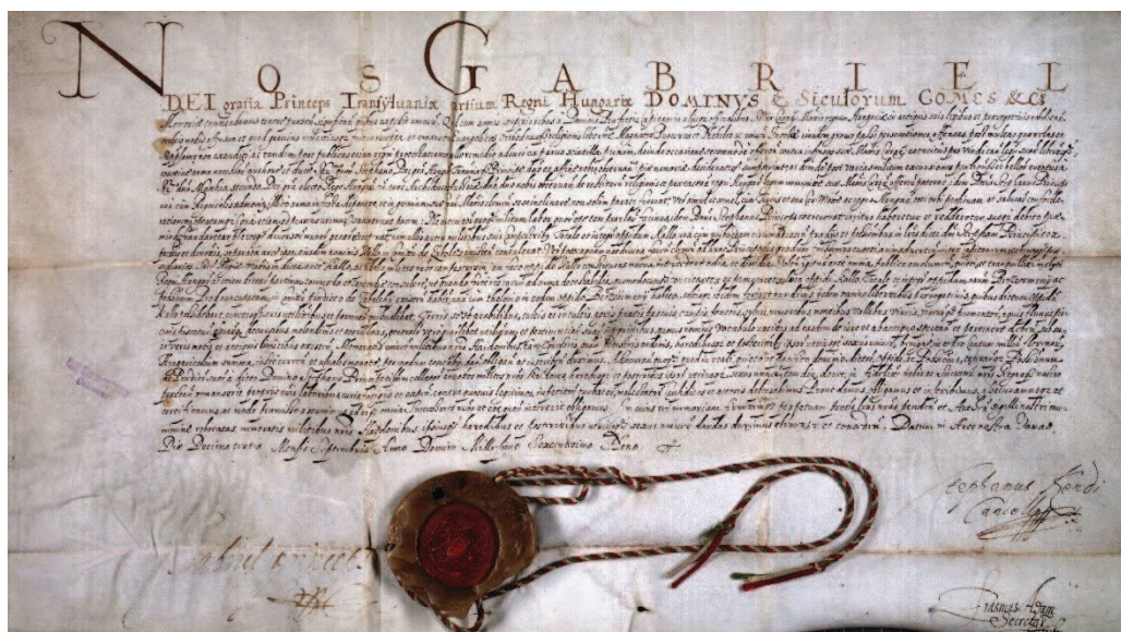
5. ábra Báthori Gábor fejedelem adománylevele

Bocskai István fejedelem 1605. december 12-én kelt kiváltságlevelében név szerint, 9254 hajdúvitézt kollektív nemesi joggal ruházott fel, s hét lakóhelyre – Szoboszló, Dorog, Nánás, Hadház, Kálló, Polgár, Vámospercs településekre telepítette őket. Kálló a Habsburg és katolikus hatalmi alközpont volt ekkor, s a jobbra kálvinista hajdúk gyakran kerültek konfliktushelyzetbe a királyi vár katonáival. A problémát feloldandó, Báthori Gábor fejedelem Váradon, 1609. szeptember 13-án újabb kiváltságlevelet adott ki, amelyben a kállói hajdúkat áttelepítette saját birtokára, amely négyszerese volt a kállói hajdú-javaknál, így negyvenezer hold birtokába jutotta