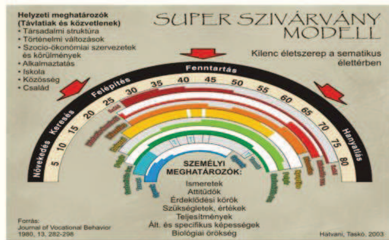
3. ábra Super modellje

A hiányalapú szükségletek teljesítése az ember fennmaradásának a feltételeit gyűjti csokorba, amelyeket a társadalom és a tér különféle ritmusban és időintervallumokban enged teljesülni. A növekedésalapú szükségletek a létfeltételeken túl mutató, a személyiség önmegvalósítása felé törekvő interakciós folyamatokat indítanak el. Az egyedfejlődés és identitás kialakulásának magyarázatához igen jól megfelel Super szivárvány-modellje, amely kilenc életszerepet-identitásvállalást jelez az életutunkban, amelyek a növekedés-keresés-felépítés-fenntartás-hanyatlás szakaszaiban eltérő erősséggel határozzák meg az „én”-azonosságunkat.