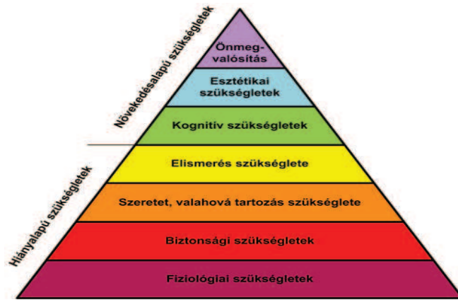
2. ábra Maslowi szükségleti rendszer piramisa

A hiányalapú szükségletek teljesítése az ember fennmaradásának a feltételeit gyűjti csokorba, amelyeket a társadalom és a tér különféle ritmusban és időintervallumokban enged teljesülni. A növekedésalapú szükségletek a létfeltételeken túl mutató, a személyiség önmegvalósítása felé törekvő interakciós folyamatokat indítanak el. Az egyedfejlődés és identitás kialakulásának magyarázatához igen jól megfelel Super szivárvány-modellje, amely kilenc életszerepet-identitásvállalást jelez az életutunkban, amelyek a növekedés-keresés-felépítés-fenntartás-hanyatlás szakaszaiban eltérő erősséggel határozzák meg az „én”-azonosságunkat.