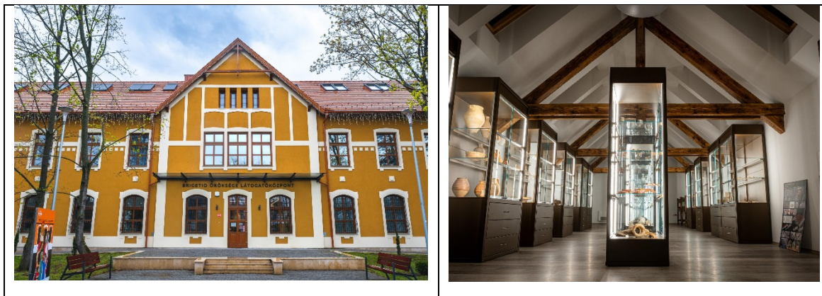
5-6. ábra: A Brigetio Öröksége Látogatóközpont