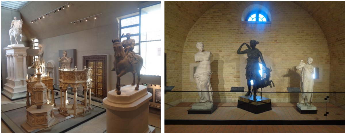
1-2. ábra: A felújított Csillag Erőd, mint kiállítóter

szobrok befogadására egy új csarnok is épült az erődben. A felújítás során létrejött „modern erőd” a 21. század követelményeinek is megfelelő vetítőteremmel (előadóteremmel), múzeumi bolttal és kávézóval rendelkezik. Az épület alkalmas múzeumpedagógiai tevékenységek folytatására, az udvar pedig szabadtéri színházként is használható (Erod.hu 2024, Index.hu 2019, Ligetbudapest 2024). A Csillag Erőd Komárom város legnagyobb (turisztikai) látványossága lett, ami 2021 októberétől várja látogatóit (Origo 2021).