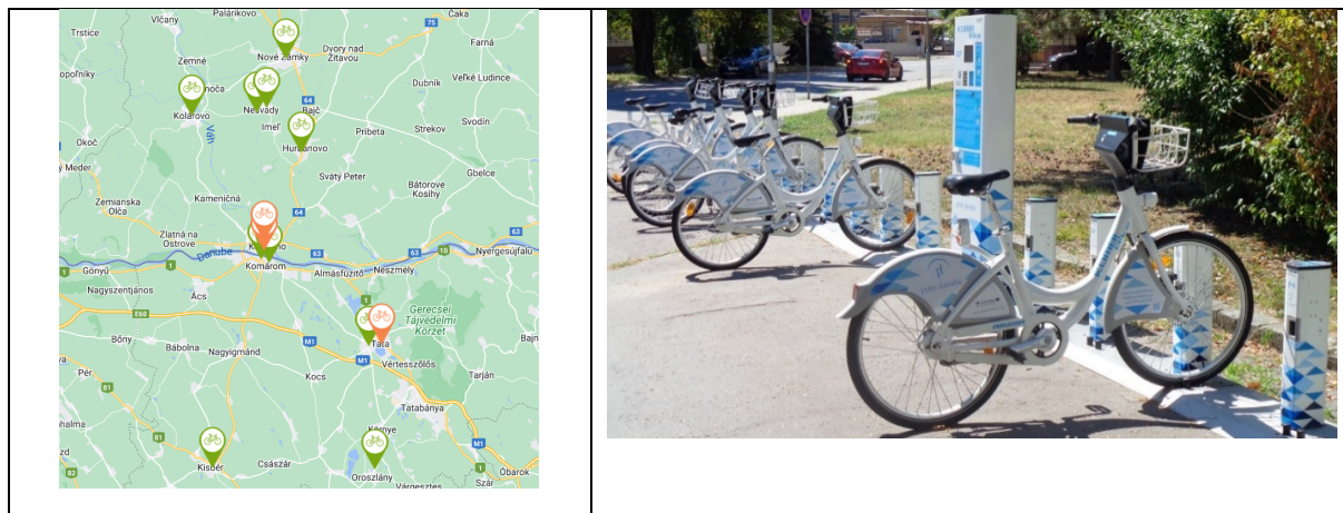
7-8. ábra: A KOMBIBIKE közösségi kerékpárkölcsönző rendszer állomáshely(i) térképen és Komárnóban

Ez a fenntartható és környezetbarát közlekedési mód motiválhatja az embereket a határtérség egyedülálló természeti és kulturális örökségének felfedezésére, valamint hozzájárulhat a turizmus és az emberek mobilitásának ösztönzéséhez, növeléséhez a határ menti térségben. A KOMBIBIKE példaértékű projektként szolgálhat más, hasonló földrajzi és történelmi helyzetben lévő térségek számára, különösen azokon a helyeken, ahol a határ összekötő funkcióját erősíteni szükséges.