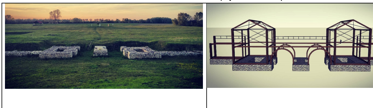
3-4. ábra: A Kelemantia római castellum déli kapuja: fotó és helyreállítási terv