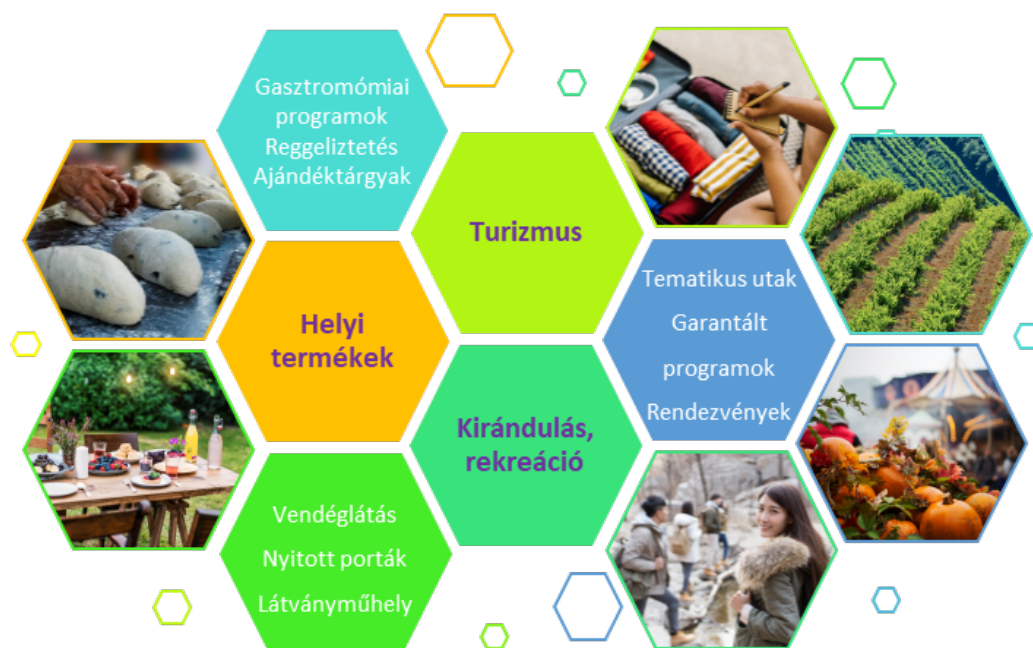
2. ábra: A területfejlesztési modell főbb elemei