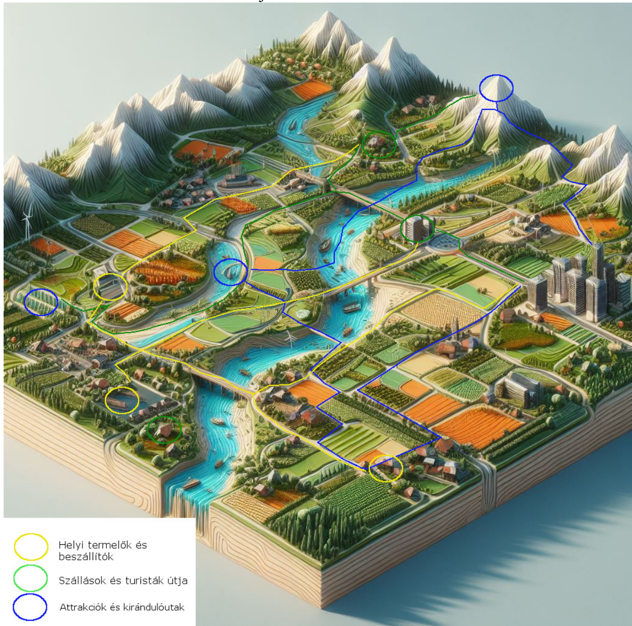
3. ábra: A területfejlesztési modell vizuális ábrázolása