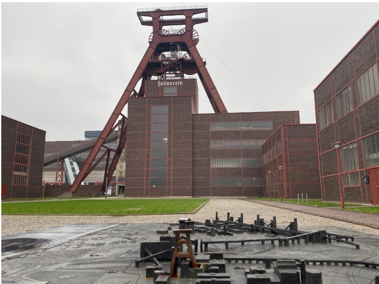
1. ábra: A Zeche Zollverein, Essen