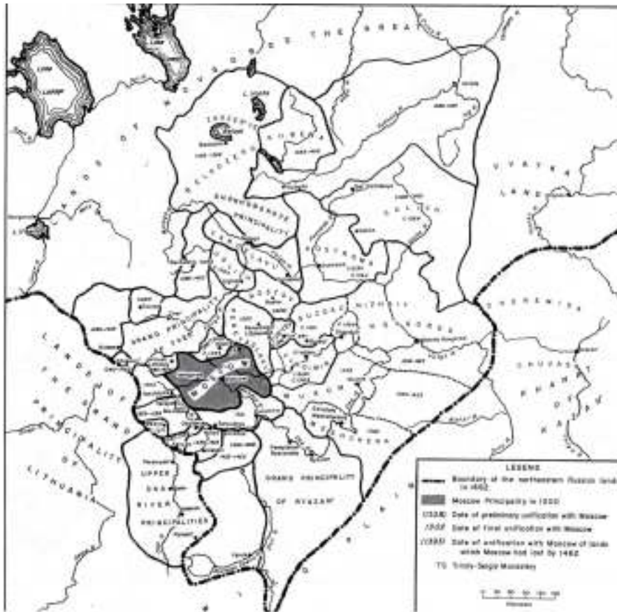
Княжества Северо-восточной Руси в 14-ом веке. (R. C. HOWES: The Testaments of the Grand Princes of Moscow . New York – Ithaca, 1967. 16.)