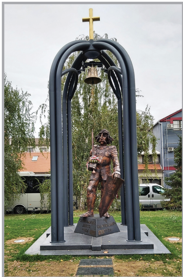
2. kép. A 2019. július 22-én felavatott belgrádi emlékmű a zimonyi Duna-parti sétányon

emlékezés, a török-magyar ellentét már csak emlék. Nándorfehérvár és Mohács emléke a két végpont, a magyar és a török győzelem mérőöldköve. Az 1456-os győzelem hetven év békét és fellendülést hozott Magyarországnak, ennek vetett véget a mohácsi vereség. Míg azonban a nándorfehérvári vereség csupán egy átmeneti fiaskó volt a Török Birodalom számára, amely sem embervesztésben nem volt jelentős, sem területi veszteséggel nem járt, a mohácsi magyar vereség hatalmas emberáldozattal és területi veszteséggel járó, az önálló magyar államiság végét jelentő tragédia volt az országnak.