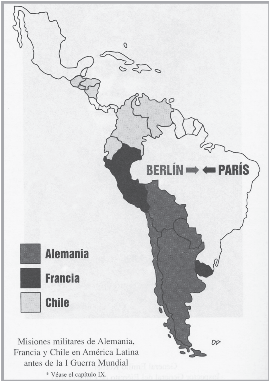
3. ábra: „Misiones militares de Alemania, Francia y Chile en América Latina antes de la I Guerra Mundial”