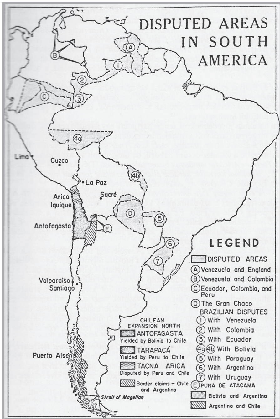
2. ábra: „Disputed Areas in South America”