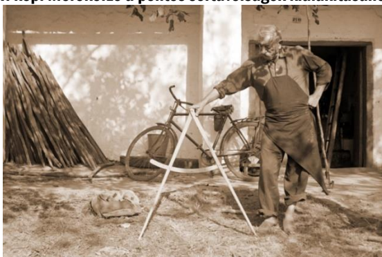
4. kép: Mérőkörző a pontos sortávolságok kialakításához

A nyél oldalcsapja lábbal való segítségre szolgál. Készült: 1966. szeptember.