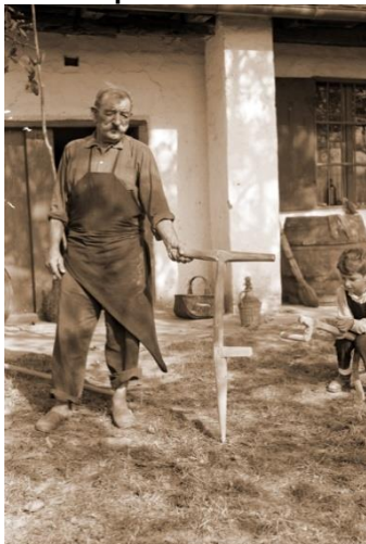
3. kép: Szőlőültető fúró

A nyél oldalcsapja lábbal való segítségre szolgál. Készült: 1966. szeptember.