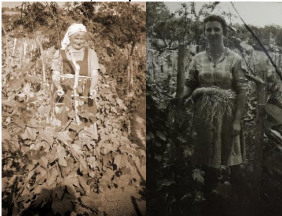
Asszonyok derekukon a kötöző rafiával. Készült: 1966. június.

A rafia a háborúk idején beszerezhetetlenné vált, így ideiglenesen visszatértek egy feltehetően korábbi gyakorlathoz és a hársfaháncsot használták kötöző anyagként. A hárs tavasszal volt alkalmas arra, hogy háncsából kötözésre használható szálakat állítsanak elő. A kérgét lehúзва annak belső felét, a háncsrészt késsel vékony szálakra vágják, így érték el a kötözésre alkalmas anyagot, melyet használat előtti este leáztatnak, hogy ne törjön el.