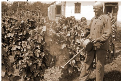
14. kép: Szőlőporozás a lisztharmat elleni védekezéséért

Az időjárás függvényében, ha esős és meleg idő jött, kénporral is poroltak, melyet fújtatóval juttattak a szőlőre. (14. kép) Ezt hajnalban kellett végezni, mert napsütéskor a kén megperzselte a szőlő levelét, valamint ventilált kénpor megtapadását a harmat segítette. Az öregebbek nem nagyon kedvelték ezt az eljárást. „De a nagypapám nem engedett porolni, aszonta megérik a boron. Fing szaga lesz.” 13