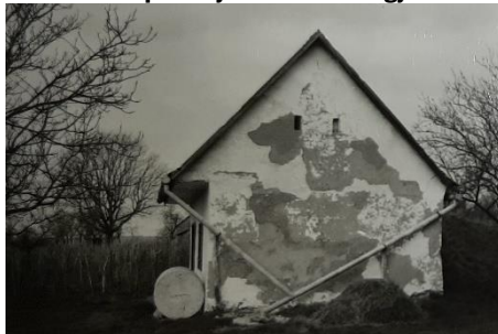
13. kép: Víznyerés a szőlőhegyen

voltak/vannak a szőlőhegyeken. 12 Igyekeztek ciszternákban gyűjteni az esővizet, amire rengeteg leleményes megoldást találhatunk. (13. kép)