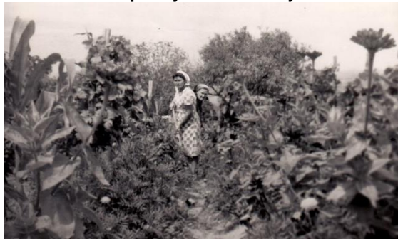
1. kép: Ízfejen álló asszonyok

Szintén gyakori volt, hogy paprikát, hagymát termeltek rajta, amit aztán helyben el is fogyasztottak.