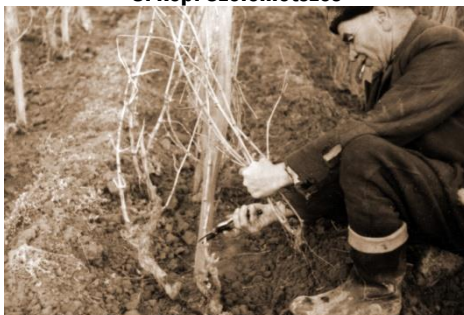
8. kép: Szőlőmetszés

A szőlők tavaszi, kikapálás utáni munkája a metszés. (8. kép) A 20. században már a metszőollók használata az általános, de sok kispincében találni még metszőkéseket, melyek eredete a római borkultúráig nyúlik vissza.