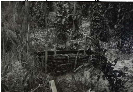
2. kép: Rekesztés az erózió megakadályozására a szőlőhegy meredekebb, vízfolyásos részében

Az erózió akadályozására rekesztéseket is csináltak a szőlőhegy meredekebb, vízfolyásos részében. (2. kép)