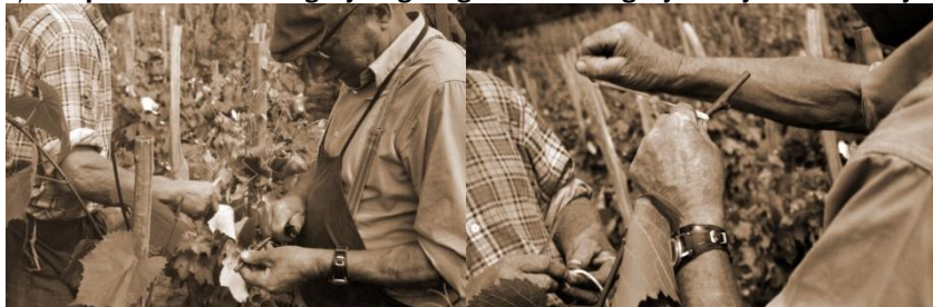
5., 6. kép: Zöldoltás: az oltógally megfaragása és az oltógally behelyezése az alanya.

„Voltak így közte-közte. Mer’ ahogy kiment a tőke, akkor vadat ültettek bele egy szálat, az megeredt, meghajtott két év múlva már, szegény édesapám beolytotta. Így, az ékbe tette, begumizta olytó gumival, én meg bekötöztem egy szőlőlevéllel, hogy ne száradjon ki a szem. Akkor jobban kihajtott, meg ha pláne lett rá egy kis eső.” 9