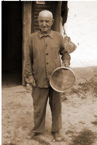
Készült: 1966. augusztus.