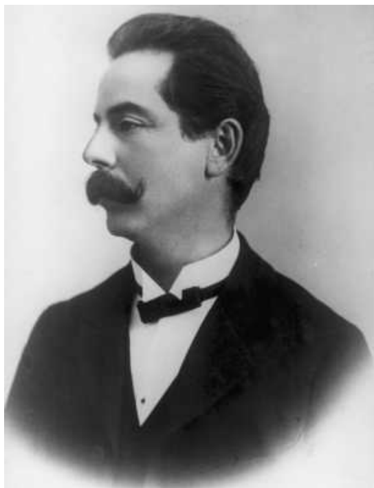
7. kép – Marczali Henrik

Marczali a Budapesti Szemlé ben válaszolt Bernatzik kritikájára, miközben egyetértően hivatkozott Illés cikkére. A történész egyrészt történeti tekintélyekre támaszkodott: szerinte a régi magyar grófok (Erdődyek) is szerződésként emlegették a Pragmatica Sanctiót. Marczali fenntartotta az elveszett területek iránti magyar jogigényt Bernatzikkal szemben. „A főrohamot azon hitlevélbe foglalt törvény ellen intézi, mely a királyt kötelezi a birodalom elvesztett részeinek visszaszerzésére és bekebelezésére. Panaszkodik aztán közjogi íróink ellen, e sorok írója ellen különösen, hogy ők ezt a tant támogatják és Magyarország jogát melléktartományaira fenntartják. (...) Vájjon Bernatzik úr belenyugszik-e abba, hogy a lengyelek örökké az orosz martaléka legyenek, hogy az oroszok sanyargassák a finneket, a szerbek a bolgárokat stb. Tessék végig gondolni ezt a gondolatot: jogfolytonosság nincs, csak a nyersерő határoz.” 56 Marczali itt egyenesen kiállt a magyar imperialista és gyarmatosító törekvések mellett – bár a lengyelek oroszok elleni függetlenségi harcai