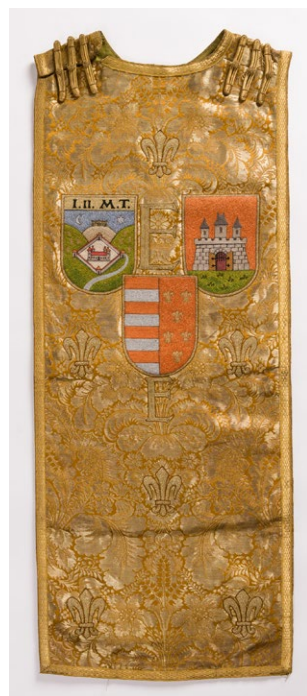
2. kép – Egyetemi díszruha Pozsony és Pécs címerével

A névváltozásokat főként különféle iratok dokumentálják, így a tárlóban kiállításra került tárgyak többsége fejléces papír, leckekönyv vagy bizonyítvány volt. Emellett he-