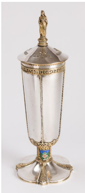
4. kép – Az Erzsébet Tudományegyetem Barátainak Egyesülete Erzsébet-serlege