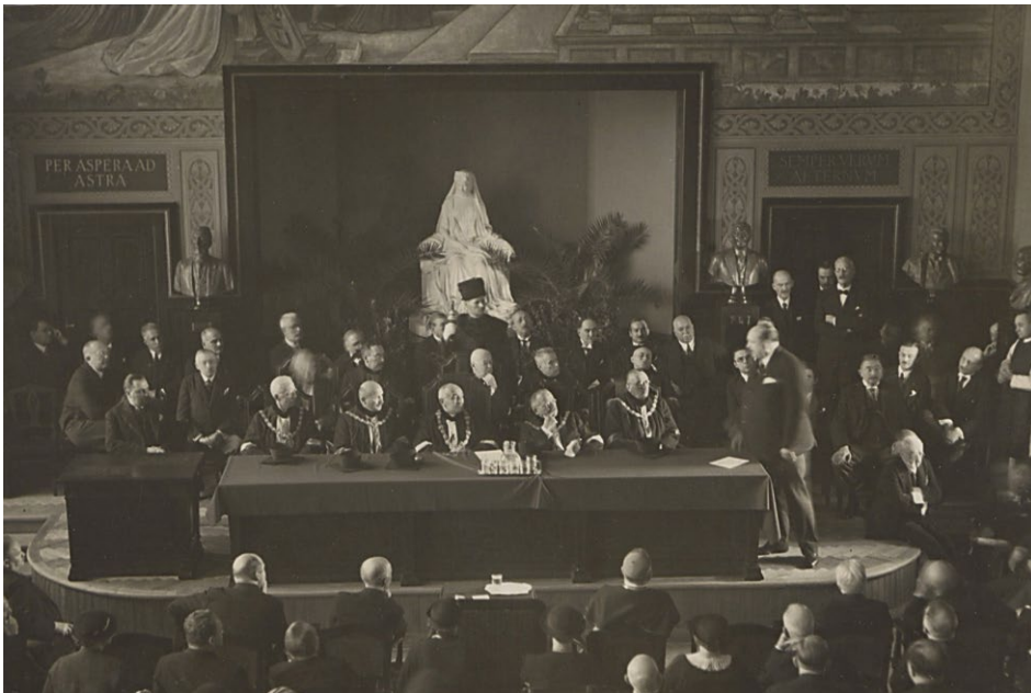
5. kép – Az egyetem aulája Szentgyörgyi István Erzsébet-szobrával

A vitrin fényképei a pécsi Erzsébet-szobroknak állítottak emléket. A hadsereg jóvoltából emelt szobrok mellett az egyetemhez köthető alkotások is megelevenedtek. A Magyar Királyi Erzsébet Tudományegyetem első pécsi tanévnyitóján az egyetem dísztermében, a Dudits-freskó alatti fülkében már állt az a porcelánból készült mellszobor, Stróbl Alajos alkotása, amely ma is itt látható. 1934 szeptemberében a Szépművészeti Múzeum letétbe