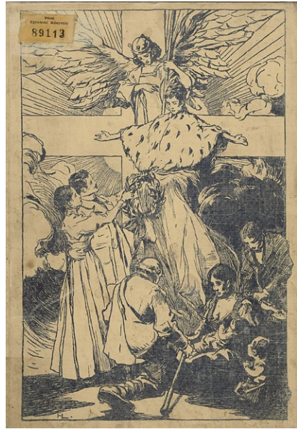
6. kép – A királyné albuma című kötet borítója

Az Erzsébet királyné, egyetemünk egykori névadója című kamarakiállítás 2024. március 31-ig volt megtekinthető a PTE Egyetemi Könyvtár és Tudásközpont Történeti Gyűjtemények Osztályán.