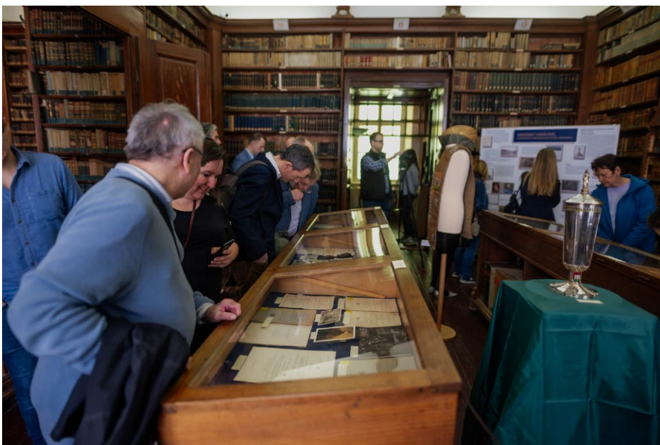
1. kép – A kiállítás megnyitó ünnepsége

A 2023. április 28-án megnyílt tárlat a Klimó Könyvtár kanonoki termének hat vitrinjében kapott helyet, ami a kamarakiállítás számára történeti környezetet biztosított. A kiállított dokumentumok és tárgyak (képeslapok, újságcikkek, fényképek, meghívók, leckekönyvek, emlékérmekek és maga az Erzsébet-serleg) sokszínűsége változatos témákat felölelve engedett bepillantást a királyné kultuszának továbbélésébe. A tárlat tematikus bontásban, ugyanakkor nagyjából kronologikus sorrendben dolgozta fel a rendelkezésre álló anyagot. Bemutatta az egyetem névadásának körülményeit és a korai pozsonyi éveket, áttekintést adott az Erzsébet-névünnepek és az Erzsébet Egyetem Barátainak Egyesülete történetéről, végül pedig megjelenítette az Erzsébet királynéhoz kötődő tárgyakat és emlékeket. Időközben megjelent a kiállítás katalógusa is. 1