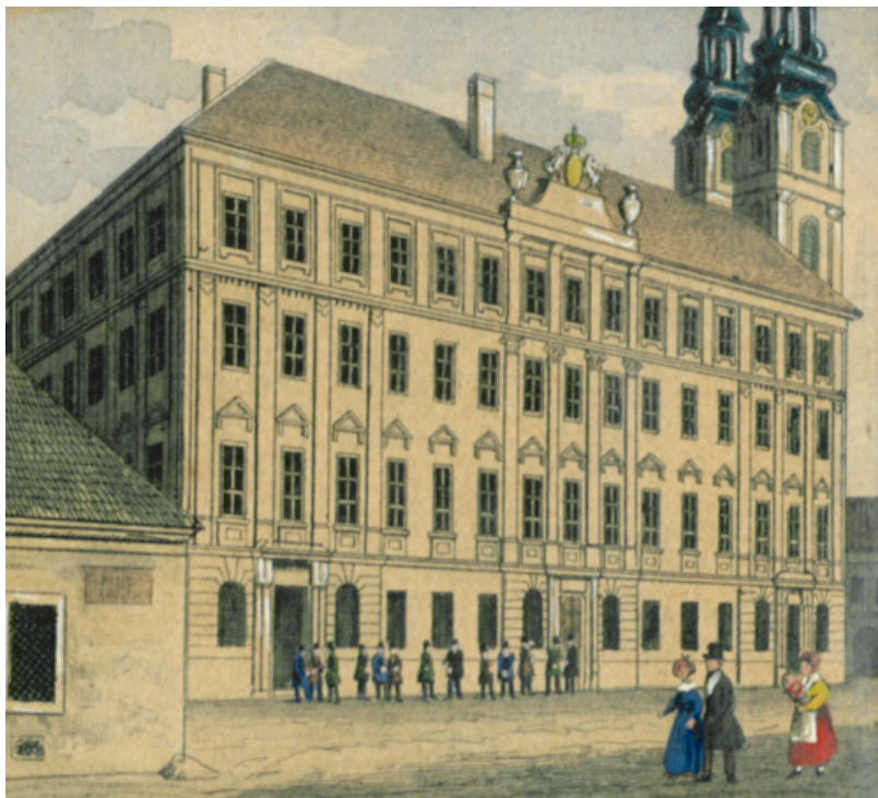
1. kép – Az egyetem központi épülete a 19. században

Marczali 1870. október 6-án kezdte meg tanulmányait. Ugyanez év decemberében megindult a képzés a Bölcsészettudományi Kar épületében lévő Tanárképző Intézetben, ahová Marczali azonnal jelentkezett. Az intézet tanulmányi ideje két év volt. A felvételi sikeres volt, és a következő tanévben, 1871. november 23-tól rendkívüli tagként már látogathatta az intézet történelem–földrajz szakosztályának óráit, és mindezért évi háromszáz forint ösztöndíjat is kapott. A következő tanévtől pedig már rendes hallgatóként járt az intézetbe két éven keresztül, míg végül az 1873/74. tanévben a gyakorló tanításai elvégzése után befejezte tanulmányait. 12