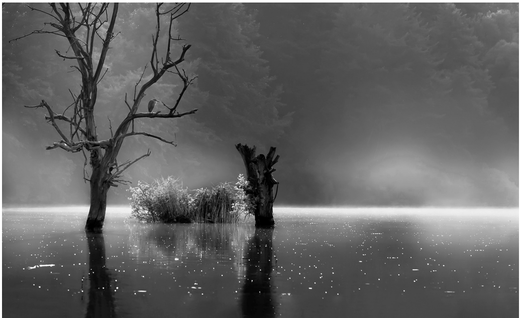
4. kép – A természet ölelésében

Ami itt van előttünk, az mind fénykép. Az itt látható műveket – bár alkalmasint különösek – lehetetlen levagdosni megélt mindennapjaink, megteremtett külső és bel-