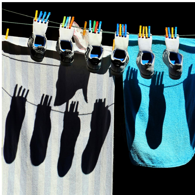
3. kép – Cipőárnyékok

Nem egyszerű és nem is szórakoztató tematikai és technikai rendszertanok szabályai szerint osztályozni az itt – talán már nem is először – bemutatkozó, válogatott anyagot. Nem volna méltó és célravezető az se, hogy a kortárs műkritika példamutató minőséget rögzítő – elváró – álláspontjait vetítsük arra, amit látunk. Mert egy különös aktus, a megemlékezés és ünneplés vegyes alkatú tárgya a kiállítás. A közösen eltöltött idő tekint vissza