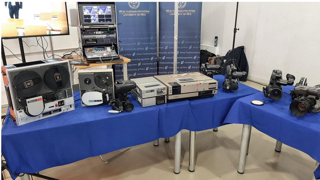
5. kép – A videotechnika-történelmi gyűjtemény részlete (2022)