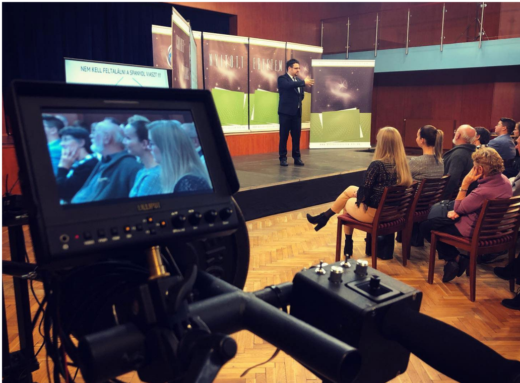
4. kép – A Nyitott Egyetem előadásának felvétele (2019)