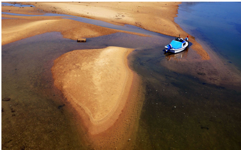
6. kép – Apály

Több könyvet is megjelentetett, mesélne ezekről?