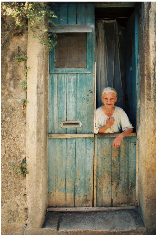
12. kép – A magány ajtajából...

viszont a földrajzi jelenségek, a tűz és a víz, tehát a vulkánok és a gleccserek érdekelnek. Ezenkívül a földrajzi tájak, amelyeket volt alkalmam szerencsére a sok utazás során látni – ezek váltak a legfontosabbá. Nagyon érdekelnek az emberábrázolások, nagyon szeretek portrézni. A szociófotót is szeretem, vagyis az emberábrázolást abban a környezetben, ahol a modell él. Ebben az Ormánságban is volt részem, de főleg külföldön. Az egyik fotóm az év képe lett, ez Lisszabon belvárosában készült egy néniről. Milyen érdekes, hogy több olyan egészalakos képet és portrét készítettem, ahol az emberek a szívükre teszik a kezüket fotózás közben! Valahol a lelkünk találkozott. Előfordult, hogy ott is homályosan láttam az érzelemtől, mert nagyon érzékeny ember vagyok. Ha meglátok egy szép momentumot egy filmben vagy egy könyvben, amit olvasok, azt megélem. Vagy ha látom a sportban, hogy a vesztes gratulál a győztesnek, és elismeri őt, én attól már lúdbőrös leszek. Más esetben egy barátnak vagy ismerősnek az elvesztése érzelmi hullámokat indít meg bennem. Ilyenkor azonosulni tudok a csenddel.