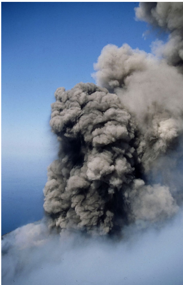
3. kép – A Stromboli kitörése