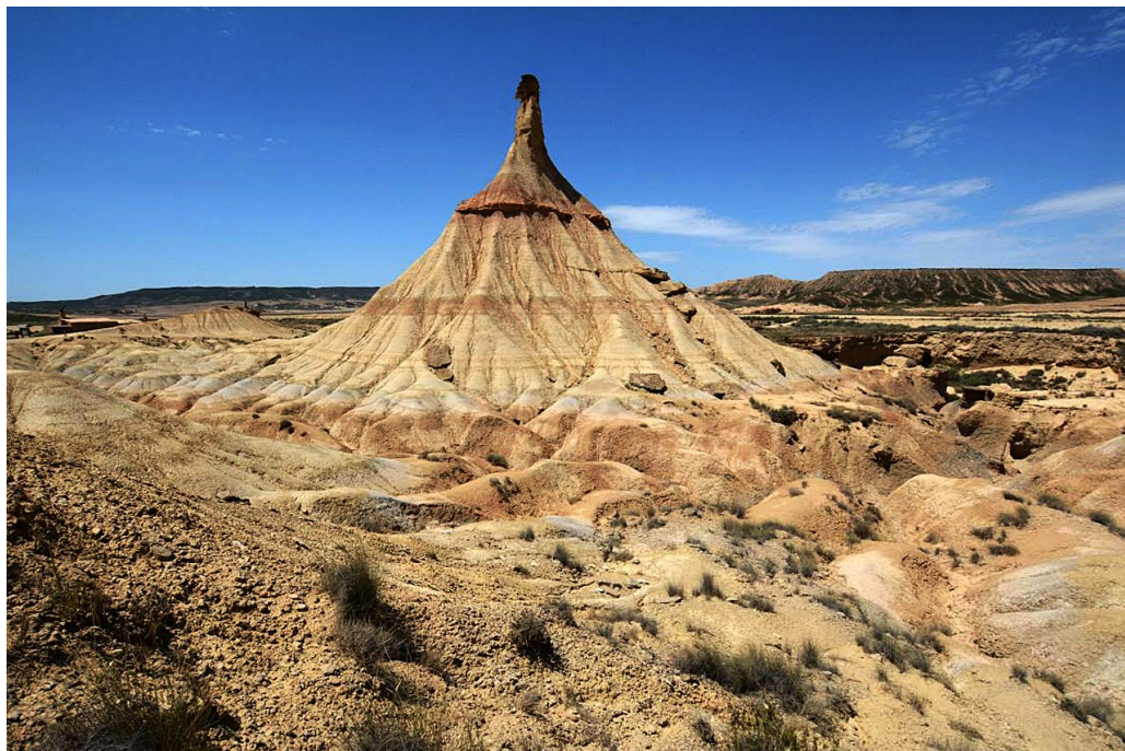
4. kép – A táj katedrálisa (Bardenas Reales, Spanyolország)