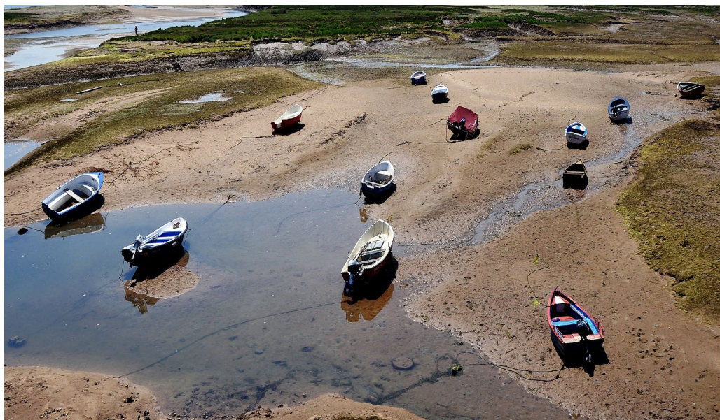
5. kép – Apály

Nekem sok mindent kellett csinálnom a Földrajzi Intézetben, a fotózás csak 20–30 százalékot tett ki. Rendszeresen vettem részt a terepgyakorlatokon, de szívesebben jártam külföldre, ahol az útjaimat a Földrajzi Intézet jórészt állta. A belépőjegyeket meg az étkezést nekem kellett biztosítani, de óriási lehetőség volt, hogy nem kellett útiköltséget fizetnem. Felmentem például Sienában, Firenzében, San Gimignano-ban egy-egy toronyba, és onnan városképeket készítettem. Ez hasznos volt a pollackosoknak, az urbanisztikának, jó