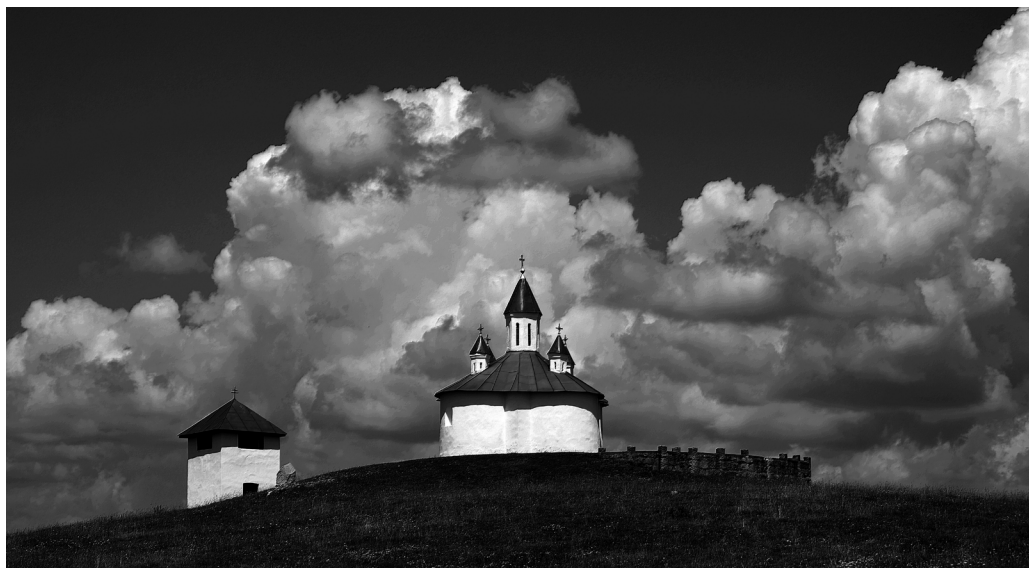
13. kép – Kézdiszentlélek, Perkő

Több témát feldolgozva előadásokat tartok, melyek 60 vagy 90 percesek. Ezeket az ország több helyén bemutattam már, és folyamatosan kapok meghívásokat, melyeket