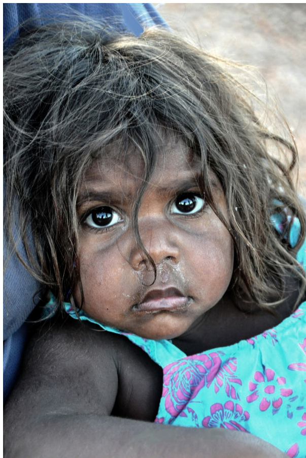
7. kép – Aboriginal gyermek (Uluru, Ausztrália)

Levelt írtam a rektor úrnak, Bódis Józsefnek, 22 akivel nagyon jó volt a kapcsolatom, hogy szeretnék tőle két dolgot kérni. Azt felelte, „kérhetsz többet is, annyi mindent adott már nekünk.” Az egyik az volt, hogy ne kelljen a négy hónapot se ledolgozni, amivel az egyetem gazdálkodik. Azt válaszolta, hogy ez természetes, fel is írta magának. A másik pedig, hogy megkaphassam a fényképezőgépet, amivel eddig dolgoztam az egyetemen. Erre is azt mondta, hogy ez csak természetes. Az utóbbiból nem lett végül semmi, a kincstári törvény miatt nem kaphattam meg a gépet, mert csak kétéves volt.