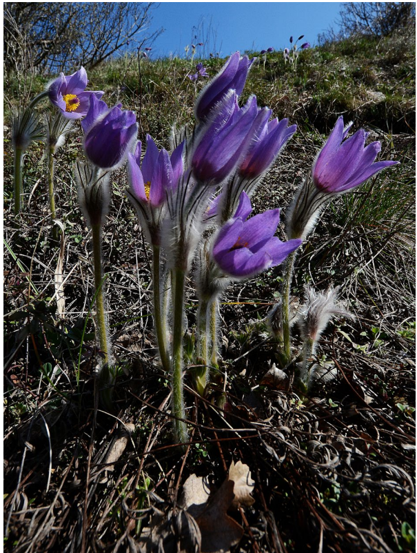
9. kép – Leánykökörcsin (Havihegy)

2022-ben 70 éves lesz a Botanikus kert. Én már régóta ezen dolgozom, és folyamatosan dokumentálom a kertet. Minden szegletét ismerem, a lakóit is, többek