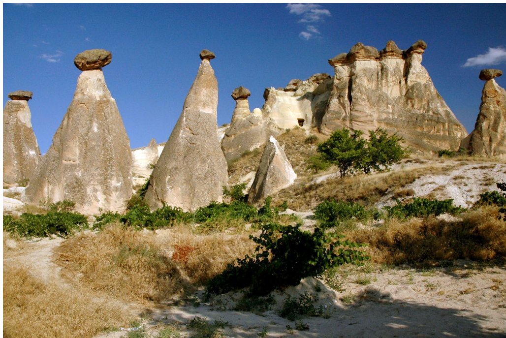
14. kép – Tündérkémenyek, Kappadókia