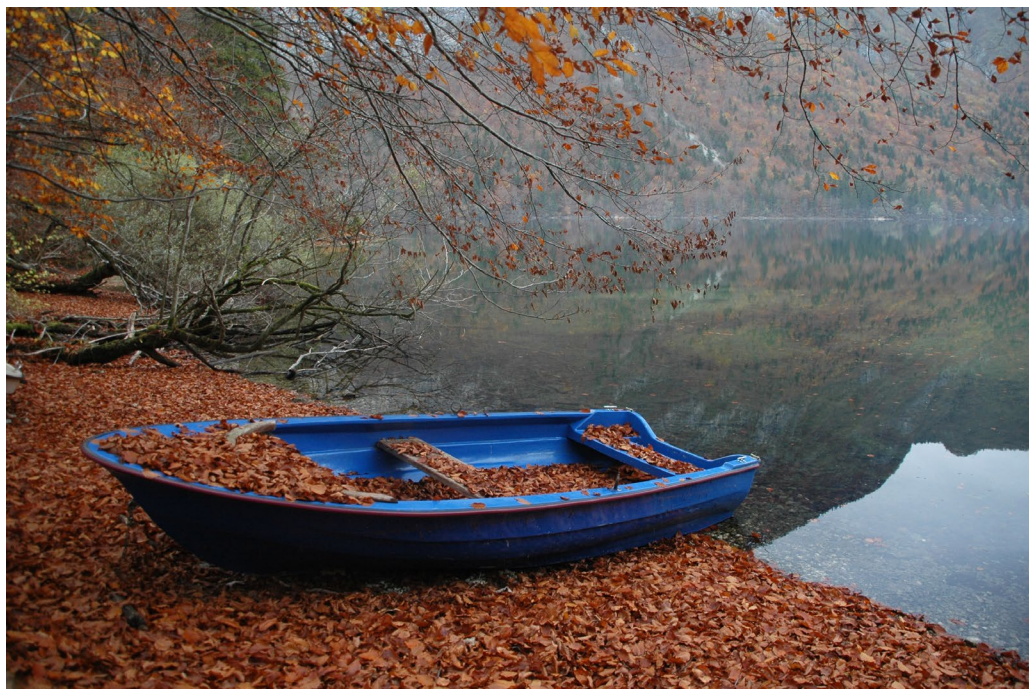
8. kép – Csend és nyugalom