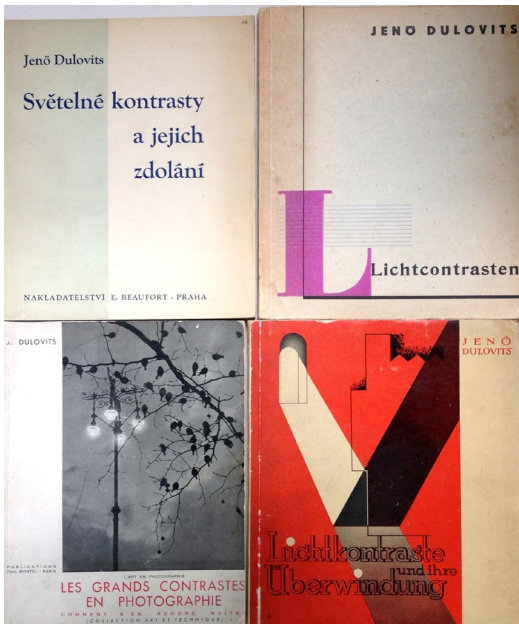
3. kép - Dulovits Jenő első könyvének cseh, holland, francia és német nyelvű kiadása.

1930-ban a Bécsi Nemzetközi Fényképképzőintézet aranyérmét nyert. 1932-ben szabadalmaztatta lágyító előtétlencsését, és azt Tóth Miklós (1908–1983) mérnök kezdte el gyártani „Soft filter, system Dulovits” néven. 1933-tól a lágyító előtétlencsét a Dulovits–Tóth nevekből képzett DUTO néven forgalmazták. Mivel ez rövidebb szó, mint a német Weichzeichner vagy az angol Soft Filter, a megnevezés a későbbi évtizedekben az egész világon a lágyító előtétlencse szinonimájává vált.