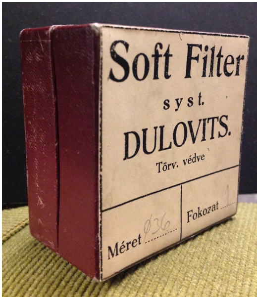
2. kép - A lágyító előtétlencse dobozának első változata.