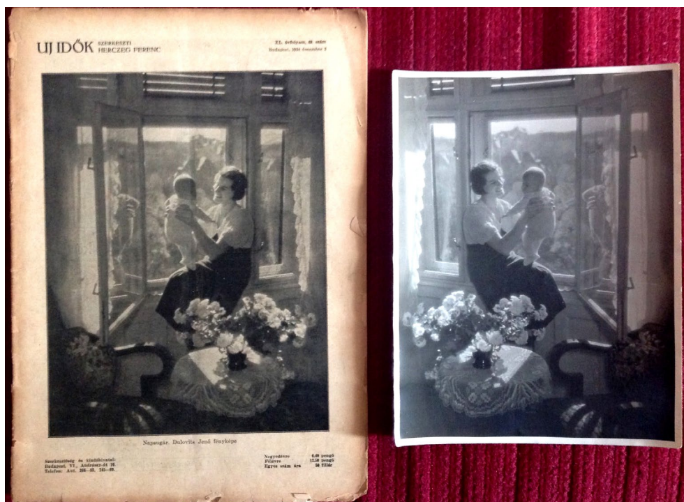
1. kép - Dulovits Jenő Napsugár című, 1934-ben készített fotója és az Uj Idők című folyóirat címlapja.