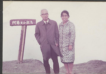
ASO melkán craterének szélén