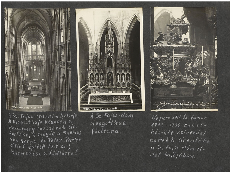
15-16. kép - Az 1. számú, 1956-1957-es csehszlovák tanulmányutató album lapjai