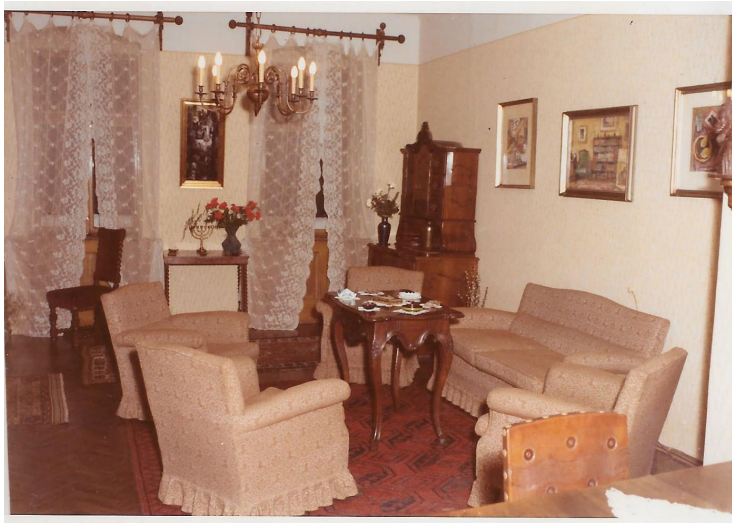
6. kép – A nappali szoba berendezése az 1970-es évek elején festményekkel és antik bútorokkal

„Visszatérve lakásunkra, a hallban – a már említett Kunffy Lajos és Vén Emil festmény mellett egy pécsi mester, Platty [sic!] festménye és a bajai Weingartner, valamint a budapesti Igmándi-Schranz festményei mellett – Elekfy Jenő, Rochboch, Szász Endre és két általa aláírt Szőnyi István rézkarc és egy nekünk dedikált Martyn Ferenc kép van. Nem részletezem a delfti, rosenthali és Zsolnay porcelán tálakat és vázákat, csupán a legrégebbi, igen szép fali tálat említem meg, amin Zsolnay Vilmos két unokája: Teréz és Júlia monogramjai láthatók. Intézeti munkatársaimtól kaptam 70. születésnapomra. Szorgos gyűjtésünk eredményeként lakásunk – túlzás nélkül állíthatom – szép, de ugyanakkor nem múzeum-szerű. Amikor első alkalommal Cserháti megyés püspök úr belépett lakásunkba azt mondta: »Ez egy valóban nagypolgári lakás, tele műkincsekkel.« 13