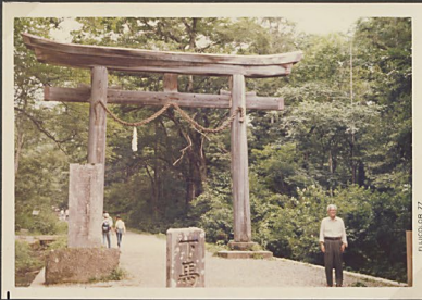
A Nagano Prefektúrában lévő Tokakūchi Shrine Torii-ja előtt