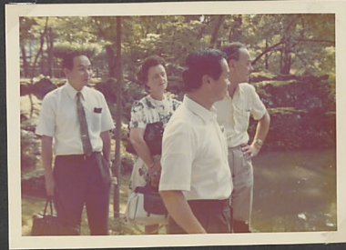
A miha Restben Kamezawa Vera, Shigetomi és val. velem