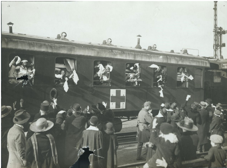
1. kép – Hollandiába utazó budapesti gyermekektől búcsúznak hozzátartozóik a Keleti pályaudvaron

A tudatos felvilágosítás, a humanitárius segélyekért több fronton indított propaganda-hadjárat eredményeképp indulhatott el az a több európai országot érintő segélyprogram, amelyet gyermekvonatokként ismer a történelmi emlékezet. Az 1920 és 1930 között zajló gyermekmentő akció kezdetén Hollandiába utaztatták befogadó családokhoz az alultáplált, magyar gyermekeket. Röviddel az 1920 februárjában a Keleti pályaudvarról Hollandia felé kigördülő első gyermekvonat indulását követően további, főként semleges országok – Svájc és Svédország, de egy vonat erejéig az antant nagyhatalom Anglia is – csatlakoztak a gyermeküdtetéshez, 1923-tól pedig Belgium is bekapcsolódott az akcióba. A legtöbb szegénysorsú – elsősorban budapesti és nagyvárosokban lakó, a társadalom szinte minden rétegéből származó – magyar gyermeket Hollandia (28 000 gyermek) és Belgium (22 000 fő) fogadta be. Az akció során több mint 60 000 gyermek számára nyílt lehetőség arra, hogy többnyire néhány hónapos, de olykor évekig elhúzódó külföldi tartózkodást követően „feltáplálva” hazatérhessen. A gyermekek egy részét – elsősorban