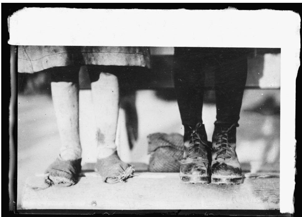
6. kép – Rongyokba burkolt lábú kislány, mellette amerikai segélyből kapott cipővel ellátott gyermek