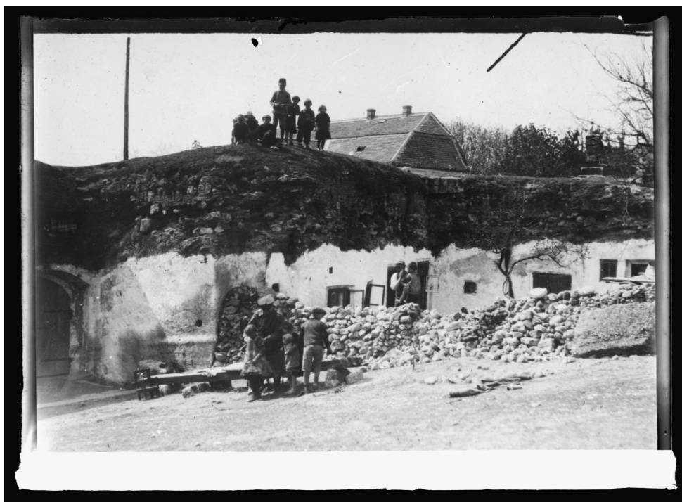
5. kép – Nyomornegyed Budapesten, 1921