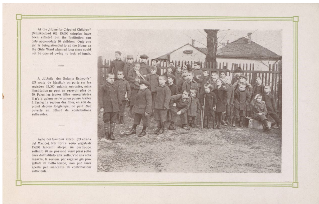
9. kép – Testi fogyatékkal élő gyermekek a Nyomorék Gyermekek Országos Otthona udvarán

fókuszában a gyermekek életkörülményeinek bemutatása állt. A filmfelvételek között ugyanakkor látunk hadirokkantakat, utcán kolduló embereket, valamint katonaruhás férfiakat és proletáraszonyokat, amint egy szeméttelen turkálnak hasznosítható dolgok után kutatva – hasonlóan a Tábori-féle szociofotós kiadványban is látható egyik képhez. A Nyomorfilm ben összesen tizenhat, Tábori nyomorazziáin készült fotográfia látható, ezek közül azonban csak három szerepel az Egy halálraítélt ország borzalmaiból című kiadványban. 24