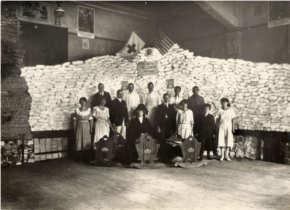
2. kép – Az Amerikai Vöröskereszt csecsemőkelengyékét oszt rászorulóknak a régi képviselőházban, 1922

va. A sorozat Budapestre vonatkozó 23 darab üvegnegatívja 1944 és 1952 között került az Amerikai Vöröskereszttől a washingtoni Kongresszusi Könyvtárba. 8 A gyűjtemény egészében elsősorban az első világháborúra, valamint az 1920-as évek elején a háborút követő rekonstrukcióra vonatkozó fotódokumentáció található. A képek Európa számos országában készültek (nem csupán a vesztesek oldalán, hanem az antanthatalmak országaiban is), a képek készítői között pedig olyan neves szociofotósokat is megtalálni, mint a gyermekmunkáról szóló sorozatáról ismertté vált Lewis W. Hine. A budapesti képek esetében sajnálatos módon a fotók készítőjének neve nem maradt fenn.