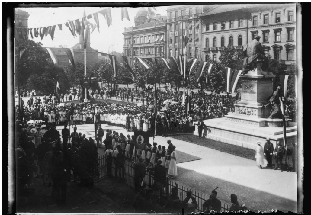
3. kép – Július 4-i ünnepség a Múzeumkertben

A sorozat témánk szempontjából legérdekesebb része azonban azok a szociófotók, amelyek elsősorban a budapesti gyermekek drámai helyzetét ábrázolják. Az egyik budapesti gyermekkórházban készült, beteg, alultáplált újszülöttek ábrázoló, sokkoló hatású képek mellett találhatunk a sorozatban egy budapesti nyomornegyedben készült helyszíni felvételt is, amely feltehetően a budapesti újságíró, író, Tábori Kornél által a későbbiekben bemutatandó „nyomorrazzia” keretében készülhetett.