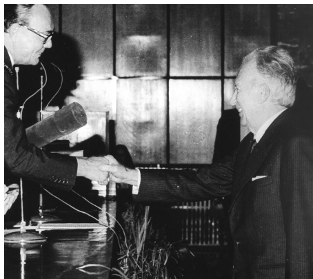
9. kép – Szentágothai János díszdoktorrá avatása (1980)

1981-ben döntöttek Andrew Victor Schally díszdoktori címének adományozásáról is, de az avatásra csak 1986-ban került sor. A Nobel-díjas Schally professzorral rendkívül jó személyes és tudományos kapcsolatot ápolt Flerkó Béla. Schally volt az, aki a POTE Anatómiai Intézetének LHRH peptidet és anti-LHRH szérumot biztosított azelőtt, mielőtt az kereskedelmi forgalomba került volna. 39 1983-ban Tapani Vanha-Perttulának (1935–1990), a kuopioi egyetem rektorának és anatómia professzorának adományozott az egyetemi tanács honoris causa címet. Perttula professzor és küldöttsége 1981-ben járt Pécsen, a két egyetem ekkor kötött testvéregyetemi és kollaborációs egyezményt, ez a szerződés volt az első, melyet nyugati egyetemmel kötött a Pécsi Orvostudományi Egyetem vezetésével. 40 1982-ben a Tübingeni Egyetemmel kötöttek megállapodást, melynek eredményeként évente oktatók és kutatók cseréjére került sor. 41