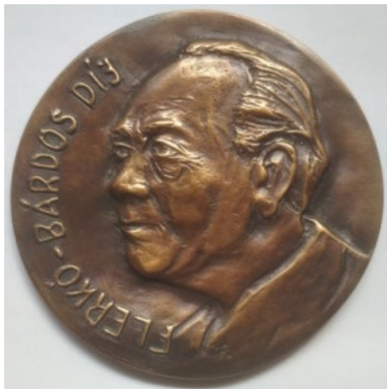
11. kép – Flerkó–Bárdos-díj emlékérem (2018)