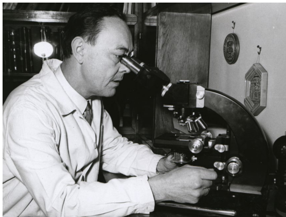
8. kép – Kutatás közben (1970-es évek)

1967-ben nyerte el a tudományok doktora címet A gonadotroph hormonok köztiagi szabályozása című disszertációja alapján. Az 1970-es évektől az agyalapi mirigy trophor- monokat termelő sejtjeinek köztiagi szabályozásáért felelős neuronrendszerek, ezek fejlődése és kísérletes vizsgálata került kutatásainak előterébe. Jelentős szerepet vállalt a szintetikus hypothalamikus hormonanalógok hatáskutatásában. 1970-ben választották a Magyar Tudományos Akadémia levelező tagjává, ami automatikusan Pécsi Akadémiai Bizottsági tagságot is jelentett számára, mely testületnek elnöki tisztségét 11 éven keresztül látta el. 1982-ben nyerte el az MTA rendes tagja címet. 33