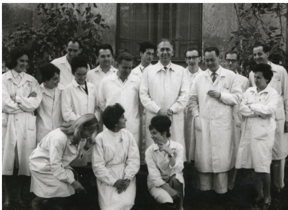
6. kép – Szentágothai János és pécsi munkatársai 1963-ban

érdemes tájkép vagy természeti jelenség mutatkozott, elővette eszközeit és 25–30 perc alatt készített aquarelleket. Örömmel vett részt a különböző alkalmakkal (farsang, tanévzáró, »társulati ülés« stb.) rendezett vidám intézeti összejöveteleken és sok időt töltött tanítványaival együtt tudományos kongresszusokon is. (...) Az ily módon baráti közösségbe kovácsolt munkatársait liberálisan kezelte. A szellemi fölényvel párosult emberszereteten és moralitáson nyugvó intézetvezetése – a Parainesis szavaival élve – »szelíd hatalommal munkával állította elő a szellemi és erkölcsi jót, s hártotta el a gonoszt.« 21