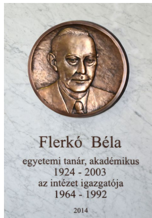
11. kép – Flerkó Béla emléktáblája az Anatómiai Intézetben (2014)