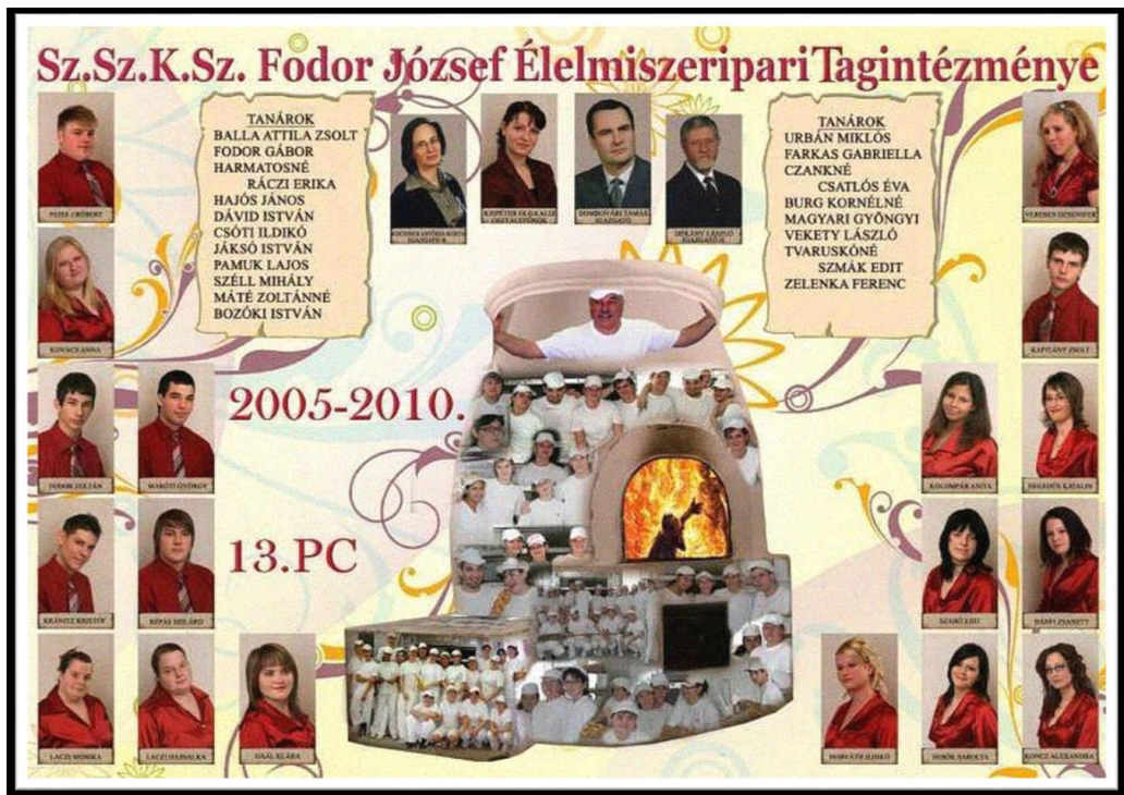
3. kép – Sz.Sz.K.Sz. Fodor József Élelmiszeripari Technikum és Szakképző Iskola, Szeged 37 13. PC tablóképe 2010.

A különböző eredetű és jellegű képek egymás mellett két korszak és identitás egymást vál- tó jelenlétének vizuális megjelenítései. Egy felületen látjuk a virgonc, felszabadult gyerme- kek csoportképeit és a „fodrásolt”, nagystélyiben pózoló (teljes csábító fegyverzetben, sminkben megjelenő) Nőket, talpig öltönyben lévő fiatal Férfiakat. Az egyéni átváltozások mellett az egzisztenciális státusváltást, illetve az ehhez való eljutás folyamatát toposzok megszámlálhatatlan sora jeleníti meg: ki-ki kedve szerint választhat (vitorlás, óceánjáró az „élet tengerén” vagy léghajó, nyílegyenes sugárút, kanyargó, keskeny ösvény, iránytű, kapu, autóbusz, homokóra, szappanbuborékok, tekerő filmkockák, bőrrönd szárnyakkal stb.).