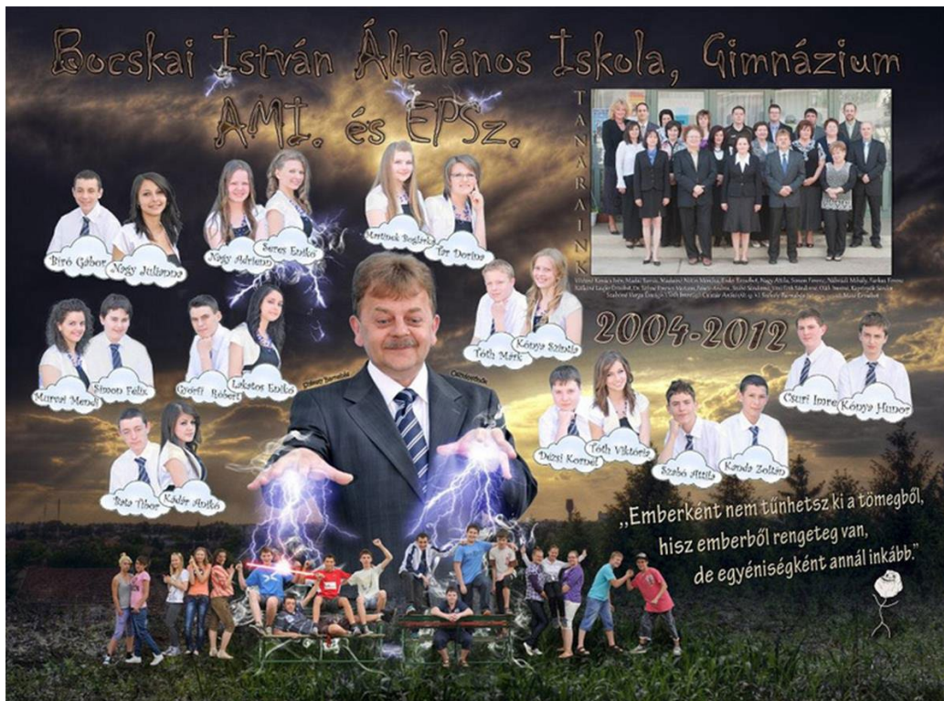
1. kép – Bocskai István Általános Iskola és Alapfokú Művészeti Iskola, Gimnázium, Hajdúnánás, 2004–2012. 26 (A tablót készítette: Eszenyi Arnold)

Akkor tudunk pontos és teljes képet kapni, s a valódi indítékokra magyarázatokat találni, ha a tablóképek születésének részleteiről vannak adataink. Itt az osztály egy fényképezni szerető ismerős fiút, Eszenyi Arnoldot bízott meg a tabló tervezésével, s ő készítette a gyerekekről a fotókat is. Az ötlet „csak úgy jött”, az osztályfőnök pedig beleegyezett, hogy