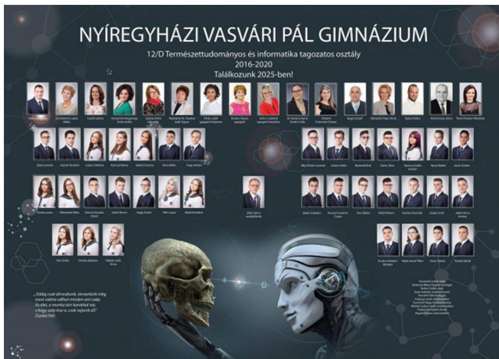
5. kép – Nyíregyházi Vasvári Pál Gimnázium 43 12.D tablóképe 2020. (Készítette: Fekete Éva)

„Volt egy számítógépes alkalmazásom, amivel lehetett fraktálokat rajzolni és »színezní«. Aki hallott már a fraktálokról, annak a Mandelbrot-halmaz ismerős fogalom lehet, ezzel kezdtem kísérletezni. A fraktáloknak van egy olyan remek tulajdonsága, hogy a végtelenségig nagyíthatók, és a nagyítás során mindig vissza-visszatérnek a kezdeti formák kisebb-nagyobb eltéréssel. Igyekeztem a nagyítás során olyan részleteket választani, ami kellően izgalmas, dinamikus viszi a tekintetet, de mégsem zavaróan komplex. Ha jól emlékszem, a végső kompozíciót szűkebb körben egyeztettem pár érdeklődővel. Színezéskor a célom az volt, hogy a tablófotók színvilágával harmonizáljon a megjelenés. Az egész kép készítéséhez pedig néhány trükköt be kellett vessek, ugyanis a számítógémem számára akkoriban kezelhetetlen nagyságú adat volt a poszter méretű fraktál és a közel 60 darab nagyobb felbontású tablófotó. Igazából színes téglalapokkal állítottam össze az elrendezést és ezt mint sablont használva töltötte ki a számítógép a végleges képekkel. Ez különösen jól jött, amikor még az utolsó pillanatokban is ment a variálás, hogy ki hol legyen a tablón. Elég volt egyszerűen, gyorsan a sablont módosítani, és a gépem már generálta is az újabb »véleges« változatot.”