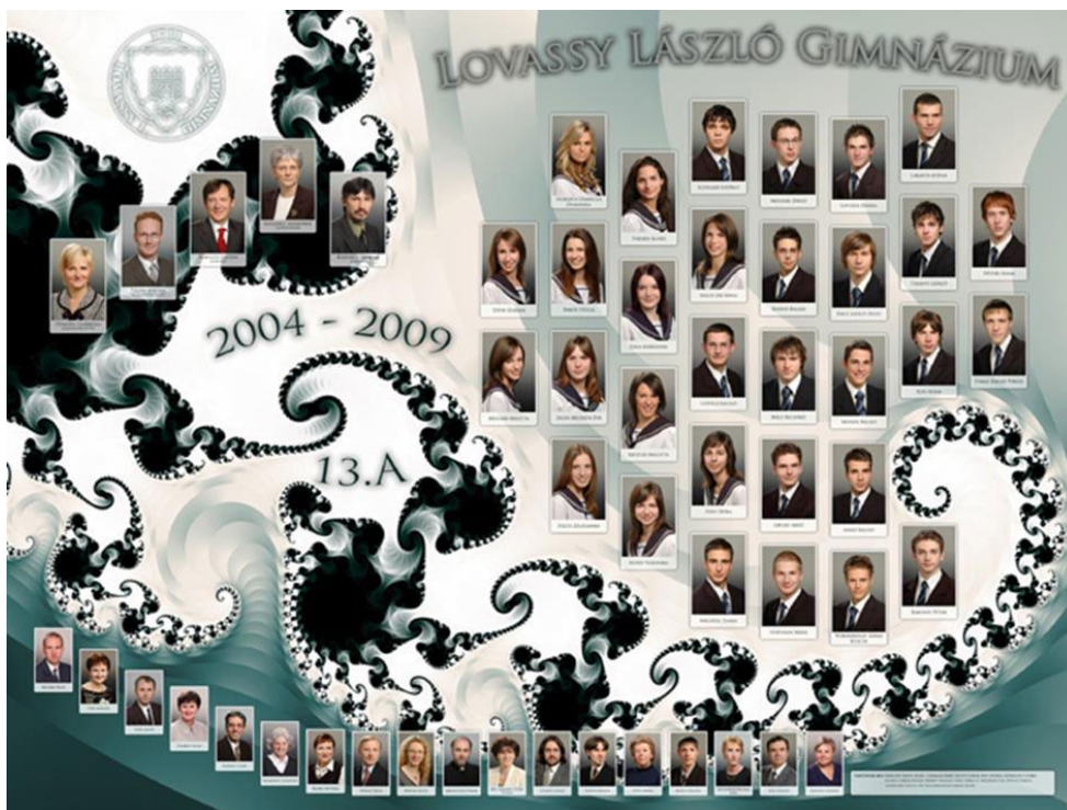
4. kép – Lovassy László Gimnázium, Veszprém. 13.A tablóképe 2009. (Készítette: Lipcsei Máté)

önmaguk közösségi „profiljának” vizuális megjelenítésére. A fraktálokat ábrázoló tabló 41 (4. kép) születését így összegezte készítője, Lipcsei Máté 42 :