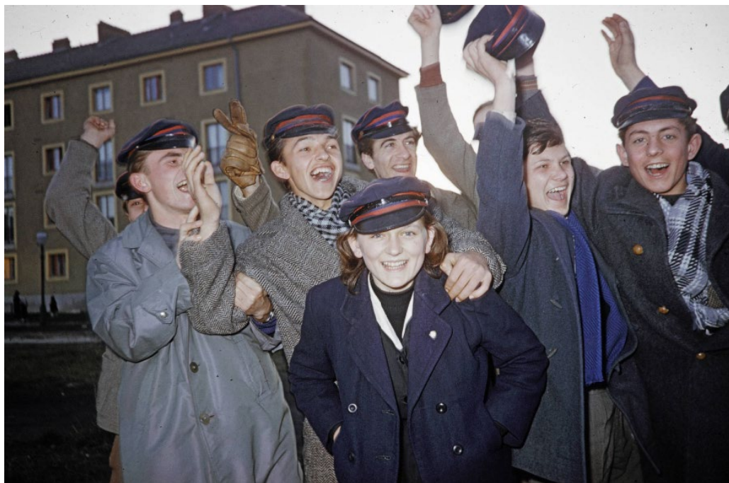
6. kép – Csapatnyi lármás szurkoló

A hatodik képen látható szurkolók jellemzésére hanghatásokat kifejező szavakat használt Forman: zajos, lármás ( rowdy, rooters ). Az eddig ismertett fotók közül ez tűnik a leginkább beállítottnak a kompozíciót tekintve – igaz, az is lehetséges, hogy a lencsébe nézők csak észrevették, hogy fotózzák őket, hiszen a takarásban lévő alakok, arcok miatt nem tűnik tudatosnak a beállítás. Az éljenző csoportból kiemelkedik az egyenesen a kamera lencséjébe tekintő, középpontban álló, fiatal lány és az őt ellenpontozó, szintén a befogóra néző fiú – a többiek mind máshová (a pálya, csapat felé?) koncentrálnak. Meccs előtt lehetünk, hiszen még nem a nézőtéren vannak a drukkerek, akik a sapkájuk színei (piros–fekete–piros) alapján a Dorogi Bányász SC futballcsapatát erősítették. A noteszben semmit sem találunk a sporteseményről, de több minden is valószínűsíti a helyszín és a meccs előtti szituáció feltételezését. Dorog közel van Esztergomhoz, a háttérben jellegzetes bányászlakásokat magába foglaló épület látható (Komlón, Tatabányán és más bányászvárosokban is hasonló az utcakép), 1960. december 4-én a Dorogi Bányásznak otthoni NB1-es mérkőzése volt a Vasassal (2:1-re kikapott egyébként a helyi csapat), 32 ez pedig egybeesik a notesz bejegyzéseivel, hiszen az amerikai fényképész itt léte utolsó napjain volt Esztergomban.