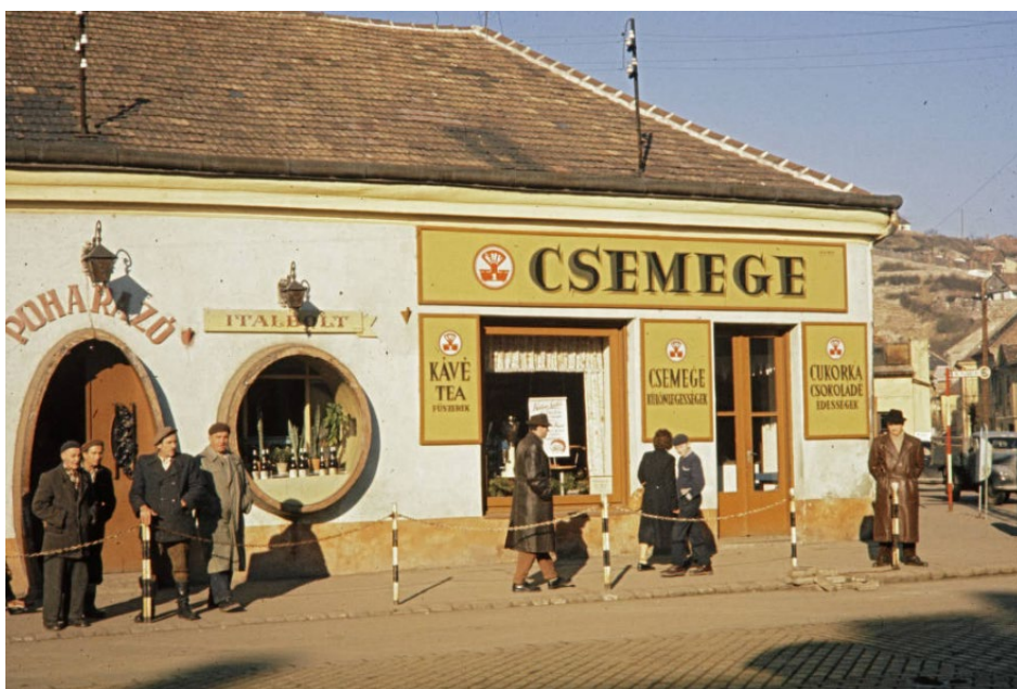
4. kép – Esztergomi utcakép

Két példával szemléltetem mindezt: elsőként egy történelmi város utcaképé- vel (Esztergom), majd egy jellegzetes szocialista iparváros mindennapi látványával (Sztálinváros). Több szempontból is látni fogjuk, hogy a negyedik és ötödik kép magába sűríti a korabeli Magyarország fejlődésének ellentmondásosságát.