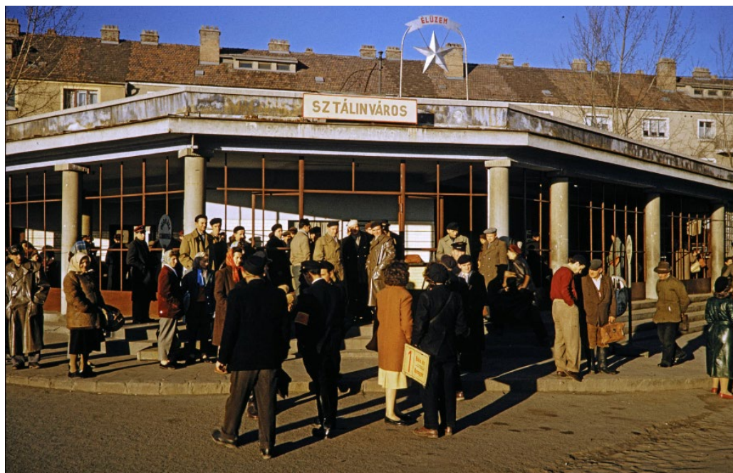
5. kép – Ingázók várnak a buszra Dunaujvárosban

A fenti idézetek a „hely hatalmára”, 26 a kulturális antropológia által jól ismert jelenségre figyelmeztetnek minket: a külső szemlélő által rögzített események, színhelyek és ezek utólagos értelmezése, illetve az ott élők emlékezete és jelentésteremtése gyakran gyökeresen eltér egymástól. Forman a kommunistáknak ellenálló Mindszenty egykori, mindennapi életterét láthatta az esztergomi utcaképből, a tanulmány írója a társadalomtörténeti vonatkozást emelte ki, míg az élete első 26 évét a városban töltő művész gyermekkorának egyik fontos momentumára emlékezett vissza Krúdy írásművészetére emlékeztető írásaiban. Ugyanannak a képnek különböző interpretációi ezek – és mind hitelesek.