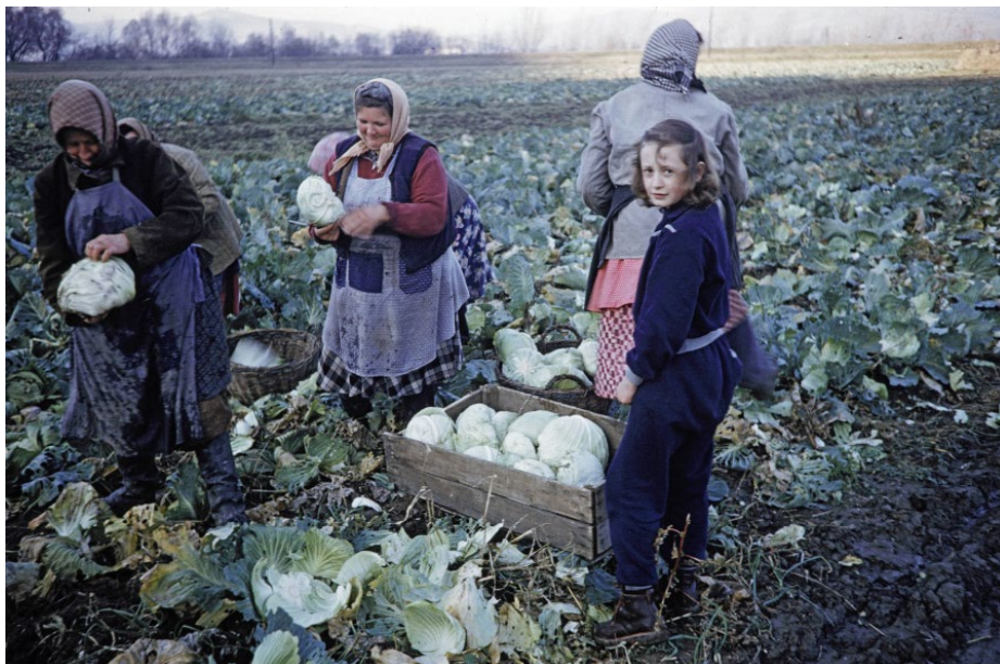
3. kép – A káposzta betakarítása

A harmadik kép egy sorozat része: hét felvétel rögzítette a káposzta betakarítását. Valószínűleg egyik fotó sem beállított – egy korábbi fényképen például az előtérben lévő kislány még háttal állva segített a felnőtteknek, ám itt már észrevette a fényképészt és szembefordult vele. Néhány fontos dolog rögtön megállapítható a fotó kapcsán: a munkaigényes szántóföldi kertészkedéshez tartozó tevékenységeket valamennyi családtag bevonásával végezték a TSZ-ben, itt például jellegzetes női elfoglaltságot láthatunk. A káposztatermesztés már régtől fogva a piacra termelés egyik fő, nyereséges ága volt a hazai parasztságnál, 17 a főváros közelsége, a jó infrastrukturális helyzet szintén elősegíthette a pettendi földek kihasználását. A betakarítás és a többi mezőgazdasági kép a tradicionális életforma továbbéléséről tanúskodik: traktor és egyéb gép csak elvétve szerepel, lófogatot annál többet láthatunk, általános a népviselet (igaz, itt a kislány már melegítőben van, megmutatva a „kivetkőzés” ismert néprajzi jelenségét, a modern városi életforma terjedését).