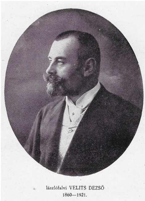
lászlófalvi VELITS DEZSŐ 1860—1921.

nőgyógyászatnak akkoriban leginkább igényelt segédtudományában, a kórszövettanban” 3 képezte magát. 1886-tól kezdve folyamatosan jelentek meg a petefészek-daganatokkal kapcsolatos publikációi, 4 amelyekben a feltárt klinikai észleléseket kivétel nélkül szövettani vizsgálataira alapozta. 5 Munkája elismeréseképpen 1887-ben második, majd első tanársegéddé nevezték ki, 1890-ben pedig Tauffer kezdeményezte Velits magántanári kinevezését a „Bevezetés a szülészetbe és nőgyógyászatba” című tárgykörből. A habilitáció végül saját kérésére elmaradt, mert közben elnyerte a pozsonyi bábaképző intézet igazgatói pozícióját. 6 Bár egyetemi karrierje ezzel látszólag véget ért, Velits 14 évnyi gyógyító, oktató és kutató munkája eredményeképpen elérte, hogy ebből a bábaképző intézetből alakulhasson meg az Erzsébet Tudományegyetem Szülészeti és Nőgyógyászati Klinikája.