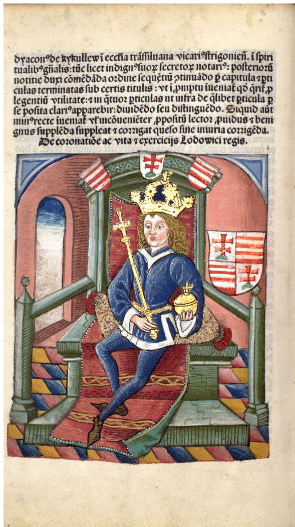
3. kép – Nagy Lajos király (1342–1382)