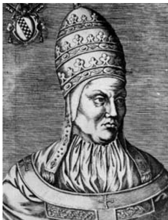
5. kép – IX. Bonifác (1389–1404)