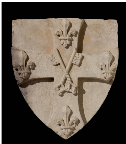
2. kép – Vilmos püspök címere, amely a Pécsi Tudományegyetem mai címerének alapjául szolgál