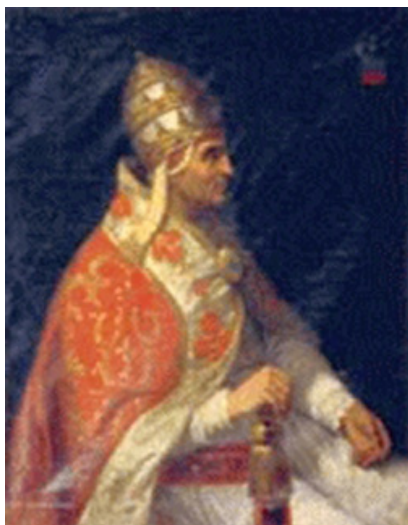
1. kép – V. Orbán pápa (1362–1370)