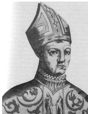
6. kép – XXIII. János (1410–1415)