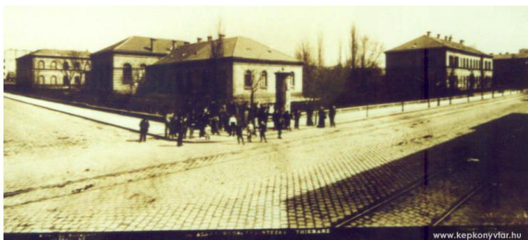
1. kép A Rottenbilller utcai campus (1881)