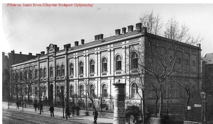
4. kép Az egykori Erzsébet leányárvaház épülete

1952-ben az iskola önállóvá vált Állatorvostudományi Főiskola néven. 1952–54-ben kisebb építkezések, átépítések valósultak meg, tanszék- és kórházbővítésre került sor. 51 Nem vált azonban valóra az 1954-es nagyszabású építési és átépítési terv. Kezdetben az állam 1,7 milliót ígért erre, míg a főiskola saját felmérése alapján a legszükségesebb fejlesztésekre kétmilliós tervet állított össze. Ez magában foglalta egy transzformátorállomás létesítését, a kísérleti állatház bővítését, szövettani gyakorlóléhség és hullakamra építését. A helyhiány mérséklése érdekében a szülészeti épületére újabb emelet építését tervezték. Miután a tervek elkészültek, kiderült, hogy a beruházás csak ígéret marad. Egyedül azt oldotta meg a városvezetés, hogy a campus területén található 14 szolgálati lakás lakóit elköltöztette, így új helyiségekhez jutottak a tanszékek. Ekkor már ezzel együtt is súlyos volt a helyhiány: a főiskolai tanácsülésen 1955-ben vita tört ki. A Parazitológiai Tanszék egy kölcsönadott helyiséget kért vissza a Sebészeti Tanszéktől, mert kísérleti juhokat akart benne tartani. A sebészet úgy tudta, hogy ő nem kölcsönbe kapta a helyiséget, ezért nem