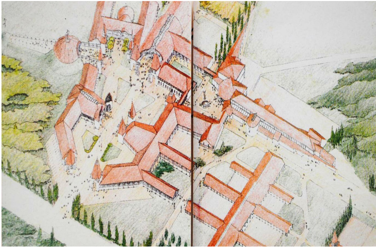
6. kép Az üllői második campus terve

paraklinika helyét. 54 Terveztek még központi épületet, éttermet, lovasközpontot és kápolnát is. Végül Üllőn csak a nagyállatklinika és a kapcsolódó központi épület valósult meg Makovecz Imre tervei alapján. (6. kép)