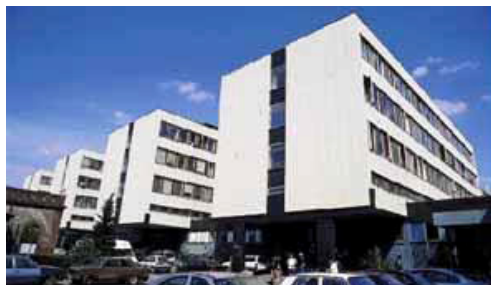
5. kép Az 1974-re felépült modern négyemeletesek

dották volna meg, hogy a tanuló-olvasó helyiséget egy pincében alakították volna ki, mivel a könyvtár is csak 60-80 főt tudott befogadni. Ez a tervzet korszerűsíteni akarta a belgyógyászati és sebészeti kisállatkórházat. Tervezték a campus bővítését kollégiummal is, olyan módon, hogy a campus mellé a Bethlen és Marek utca vagy a Landler Jenő (ma István) és a Bethlen utca találkozásánál található telket sajátították volna ki.