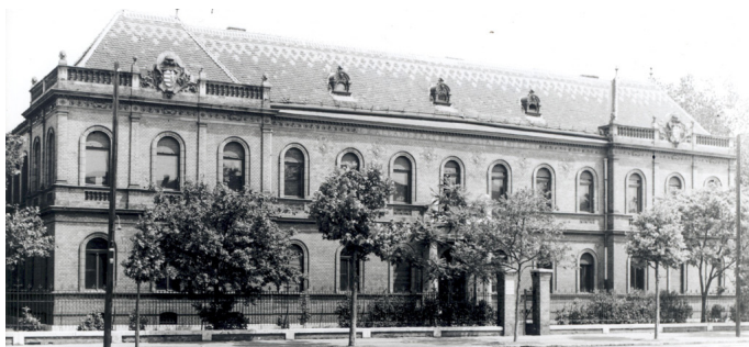
2. kép A Magyar Királyi Állami Bakteriológiai Intézet épülete

Az 1900-as évek elején a helyhiány megoldására a költözés ötlete is felmerült. Szerencsére végül 1908-ban az Oetl-gyár megvétele megoldotta a problémát. Ekkor a gyár