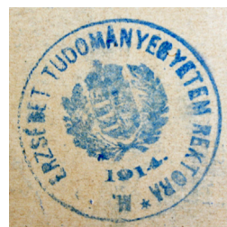
3. kép Az Erzsébet Tudományegyetem rektori pecsétje, a „királyi” jelző kitarakva (1947)

Az intézmény a Magyar Királyi Erzsébet Tudományegyetem elnevezést egészen az 1944/45. tanévig használta. A második világháború után tért nyerő koalíciós politikai berendezkedés ugyanis nem sokáig tűrte meg az uralkodókra vagy a Horthy-korszak prominenseire történő utalásokat a tudományegyetemek nevében. 53 Először – az államforma változásával – a jelzők tűntek el. A „királyi” jelzőt, illetve annak rövidítéseit az Ideiglenes Nemzeti Kormány 539/1945. M. E. számú rendelete törölte el, mely a Magyar Közlöny 1945. március 24-i számában jelent meg, s később az 1946. évi I. 19. §. is megerősítette. A jelző eltörlését a jogi és az orvosi kar tanácsa hozzászólás nélkül vette tudomásul. 54 (3. kép)