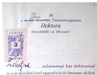
5. kép Egy 1948-ban beiratkozott hallgató indexének első oldala (részlet)