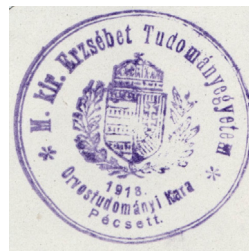
2. kép Az Erzsébet Tudományegyetem Orvostudományi Karának pecsétje (1927)