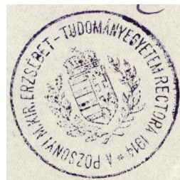
1. kép A pozsonyi m. kir. Erzsébet Tudományegye- tem rektori pecsétje (1914)

Az egyetem a budapesti elhelyezést ideiglenesnek tekintette, s ezt névhasználatával is alátámasztotta, hiszen továbbra is következetesen használta a „pozsonyi” jelzőt, egészen 1921-ig. A csehszlovák hatóságok azonban igyekeztek a felvidéki diákok magyarországi tanintézetekben folytatott tanulmányait akadályozni: tiltották az útlevelkiadást, nehézségeket gördítettek a magyarországi egyetemeken szerzett diplomák nosztrifikálása elé, 33 s