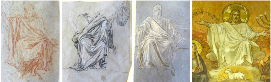
3. kép – Lotz Károly: Trónoló Krisztus. a–c) három vázlat, Magyar Nemzeti Galéria, Grafikai Osztály, Pécsi székesegyház című mappa. d) freskó, pécsi székesegyház, Corpus Christi-kápolna, Apokalipszis

Egy-egy alakhoz akár több kéztartást is kipróbált, ez figyelhető meg a Jézus szíve-kápolna Keresztrefeszítés-freskójának Mária Magdolna alakján, vagy Corpus Christi-kápolna Apokalipszisének trónoló Krisztus figuráján. A trónoló Krisztus alakhoz öt vázlatot készített Lotz, különböző kartartásokkal kísérletezve (3. kép). Három kartartást próbált ki a