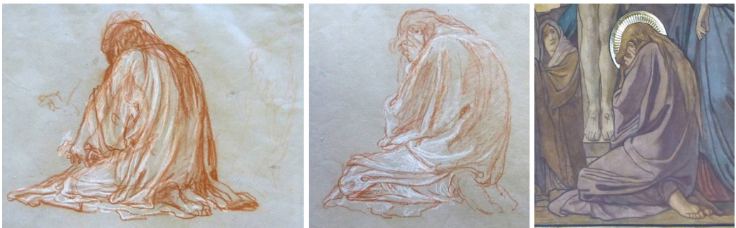
4. kép – Lotz Károly: Mária Magdolna. a–b) két vázlat, Magyar Nemzeti Galéria, Grafikai Osztály, Pécsi székesegyház című mappa. c) freskó, pécsi székesegyház, Jézus szíve-kápolna, Keresztrefeszítés

Gyakran egy-egy alakról először meztelenül készített vázlatot, majd utána ruhástul.