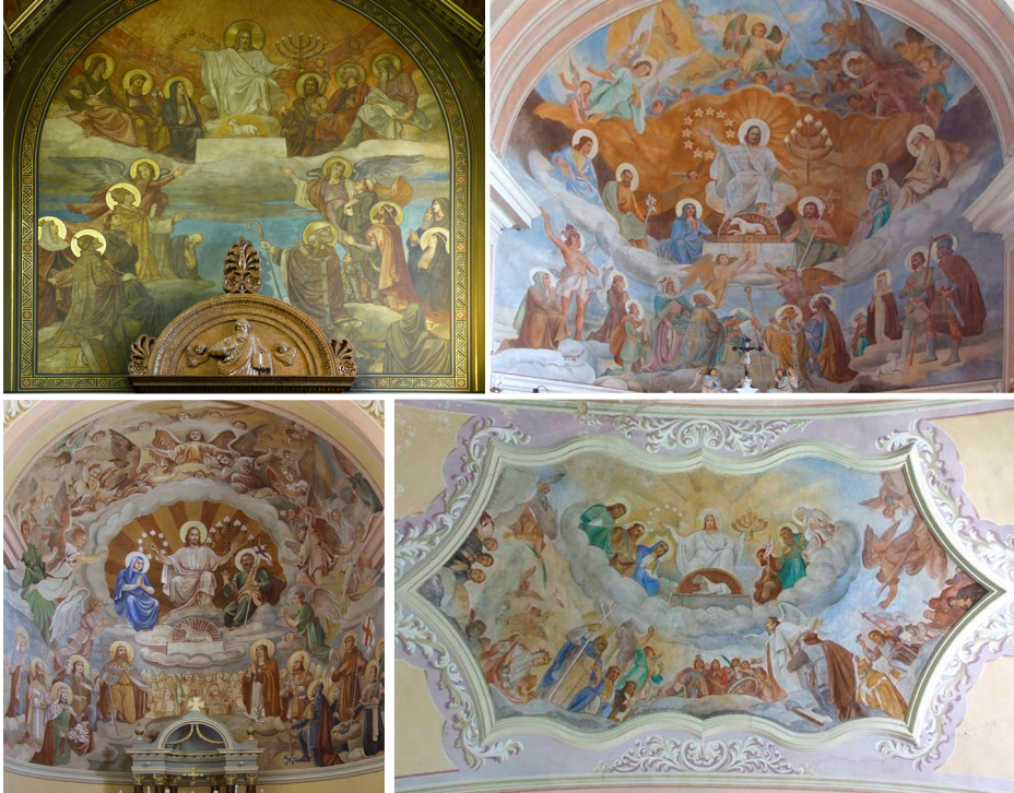
5. kép – a) Lotz Károly: Utolsó ítélet, pécsi székesegyház, Corpus Christi-kápolna. b) Gebauer Ernő: Utolsó ítélet, Szakály, Minden-szentek templom. c) Gebauer Ernő: Utolsó ítélet, Felsőmindszent, Mindenszentek templom. d) Gebauer Ernő: Utolsó ítélet, Magyarke-szi, Szent Mihály arkangyal templom

Gebauer Ernő Székely Bertalan tanítványa volt 1906–1910 között, de nemcsak Székely freskói hatottak rá a pécsi székesegyház alkotásai közül. Szoros kompozíciós párhuzam mutatható ki Lotz Károlynak a Corpus Christi-kápolnában megfestett Utolsó ítélet-freskója és