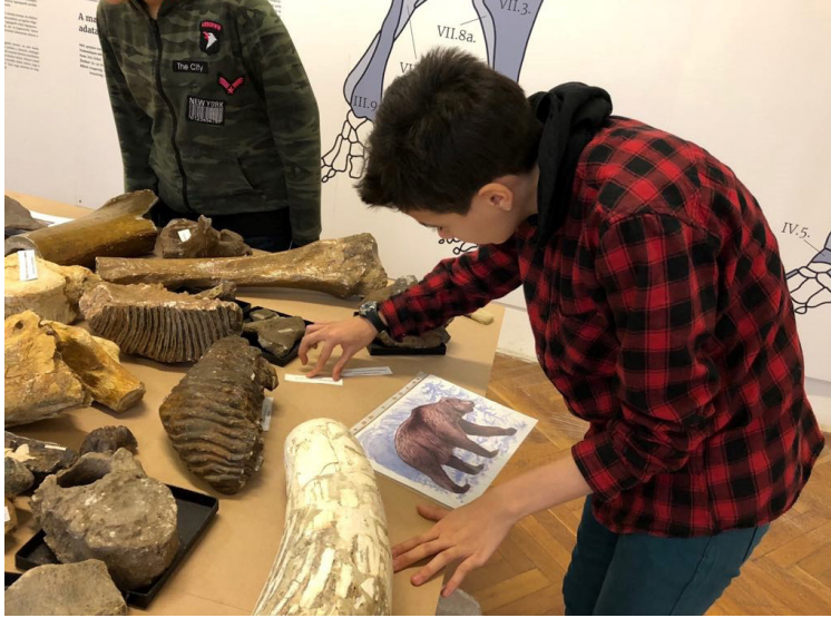
2. kép – Látogatás a Janus Pannonius Természettudományi Múzeumban. A múzeumi tárgyak leírása 14

A BREL-ben szintén kihasználjuk a levéltár adta tanulási környezetet: közösen megnézzük a raktárakat, kézbe vesszük a levéltári dobozokat, majd a tanulók összeírják a polcokon lévő jelzeteket. A gyűjtőkör fogalmának bevezetéséhez tisztázni kell a levéltár és az irattár közti különbséget is, ami 12 éves tanulók esetében nem egyszerű feladat. Ehhez különböző típusú információforrásokat tartalmazó szövegeket kapnak, melyeket fel kell dolgozniuk egy feladatlap segítségével. A kritikus gondolkodást elősegítő feladat megoldását poszter formájában rögzítik (3. kép).