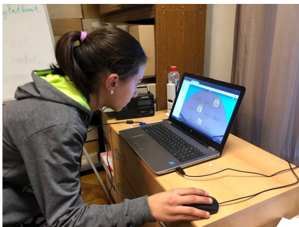
4. kép – A levéltári fogalmak begyakorlását célzó, WordWall alkalmazással készített interaktív játék

Általános iskolások számára szervezzük a foglalkozássorozatot, mely kifejezetten a felsős tanulók esztétikai és művészeti kompetenciáinak a fejlesztését szolgálja. A „foglal-