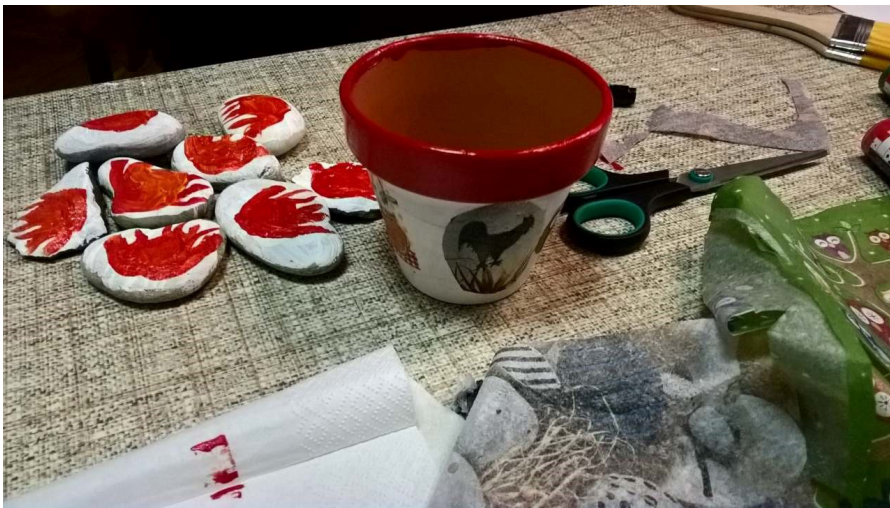
5. kép – Tűz és a kakas

kozássorozat” elsősorban kézműves foglalkozásokat takar, melyek egy héten keresztül napi 2 óra elfoglaltságot jelentenek 8 általános iskolás tanulónak. 2018 júniusában egy héten keresztül ismerkedtek a PRK felsős tanulói az ormánsági kazettás templomok díszítő motívumaival és református jelképekkel, majd ennek hatására készítettek tárgyakat kavicsfestés és dekupázs-technika alkalmazásával. Nagyon szép ajándéktárgyak, festett virágcserepek és kavicsdíszek kerültek ki a tanulók kezeiből (5. kép). Egy elfeledett társasjátékot elevenítettünk fel, amit saját maguk készítettek el a diákok: malomjátékot rajzoltak meg kartonlapra és jelképeket ábrázoló, festett kavicsok alkották a „bábukat”. Természetesen mielőtt nekiláttak a feladatnak, fel kellett eleveníteni a játékszabályokat. A végén kipróbálták az elkészített malomjátékaikat.