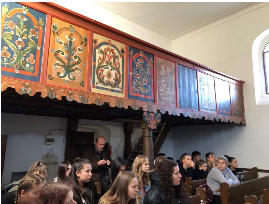
6. kép – A PRK Internátusának diákjai Kémesen a reformátusok hímes templomában 2018 őszén