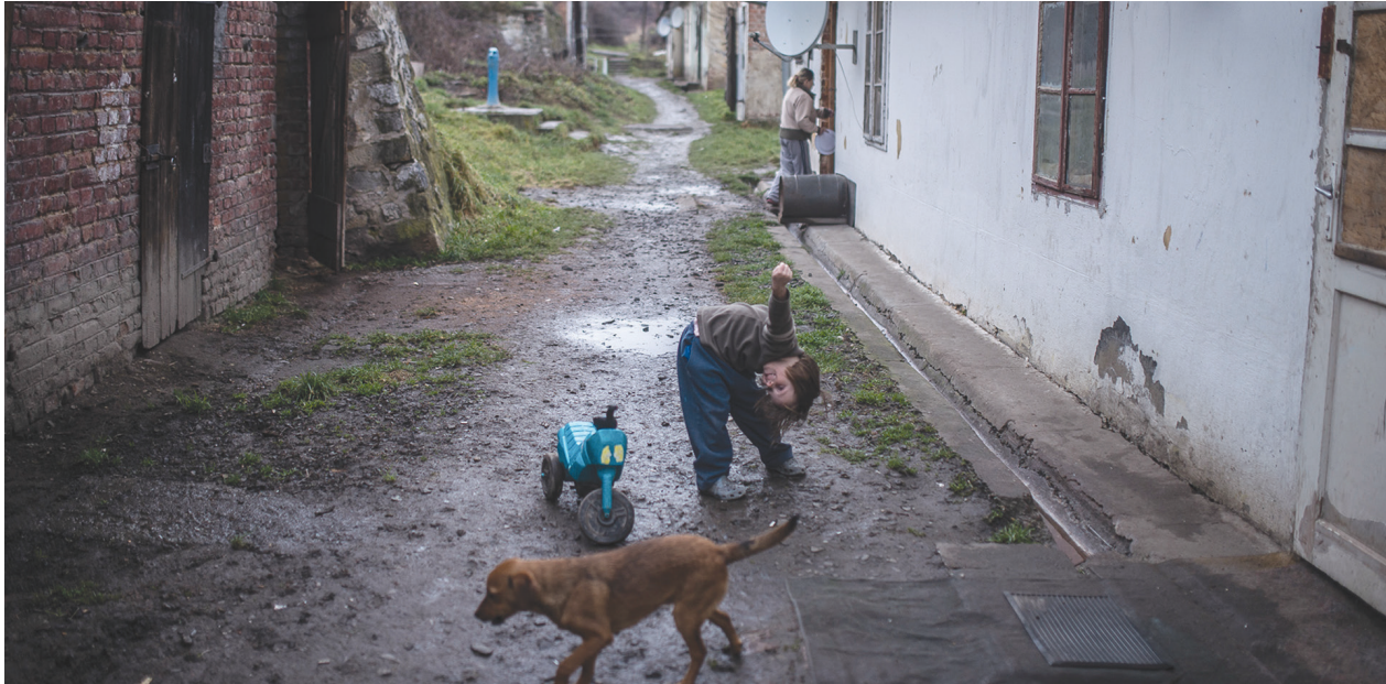
Pécs György-telep.

városokban, többek között Esztergomban, Miskolcon, Veszprémben, illetve az ország számos kisebb településén is működik a program. Alapját az intenzív terepi szociális munka képezi, melyet a települések lakosainak segítségével felállított diagnózisok szerint folytatnak az MMSZ munkatársai.