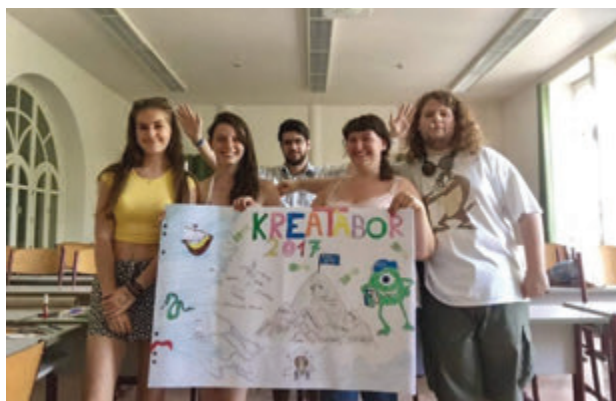
Szádoczki Virág csoportképe

„A Pécsi Tudományegyetem nem azért szervezi ezt a tábort, hogy rábeszéljenek a PTE-re, hanem azt akarják, hogy benézhess a kulisszák mögé, utána pedig eldöntheted, hogy ide szeretnél-e jönni, vagy máshova. Nekem nagyon sokat segített a tábor abban, hogy a tanári pályát válasszam. A seniorokon – vagyis olyan hallgatókon keresztül, akik itt tanulnak – nagyon jó volt megtapasztalni, hogy milyen is a tanári szak.”