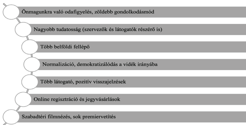
3. ábra: A Covid-19 járvány pozitív hozadéka a fesztiválok szervezői szerint Figure 3. Positive outcomes of Covid-19 for festival organizers