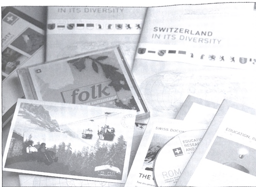
A Presence Switzerland információs anyagai

ad-hoc programjaink is. Ilyen volt Magyarországgal a tavalyi évben 1956 kapcsán az „oda-vissza” program. Alapjában véve három fontos dolgot teszünk: külföldi projektjeink vannak, információs anyagokat gyártunk, és delegációkat hívunk az országba. Tavaly például a Presence Switzerland 500 embert fogadott, akiknek jelentős része fiatal volt. Ők ugyanis kiemelt szegmenst jelentenek számunkra, az országról szerzett ismereteik továbbadásával rengeteg em-