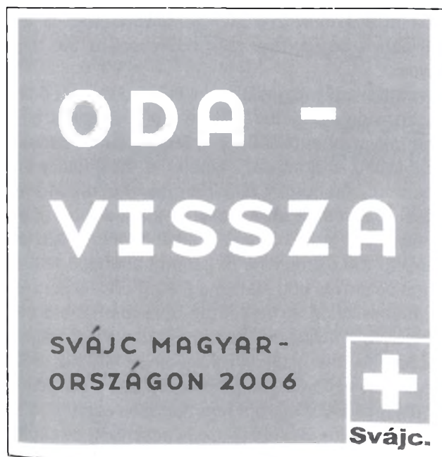
Oda-Vissza Program: Svájc Magyarországon

ad-hoc programjaink is. Ilyen volt Magyarországgal a tavalyi évben 1956 kapcsán az „oda-vissza” program. Alapjában véve három fontos dolgot teszünk: külföldi projektjeink vannak, információs anyagokat gyártunk, és delegációkat hívunk az országba. Tavaly például a Presence Switzerland 500 embert fogadott, akiknek jelentős része fiatal volt. Ők ugyanis kiemelt szegmenst jelentenek számunkra, az országról szerzett ismereteik továbbadásával rengeteg em-