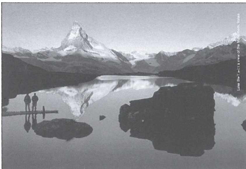
Svájc kapcsán a külföldiek legelső asszociációja a szép táj

Japánban. Ezeken a helyeken 1000 fős „átlagpolgári” mintát vettünk, 100–121 menedzsert kérdeztünk meg, és 100–150 a politikai szférában dolgozót. Kiderült, hogy mindenütt és szinte minden téren pozitív a megítélésünk. Kivétel azért akadt: Nagy-Britanniában például a politikusok körében végzett kutatás azt mutatta, hogy Svájc megítélése 100-as skálán mindössze