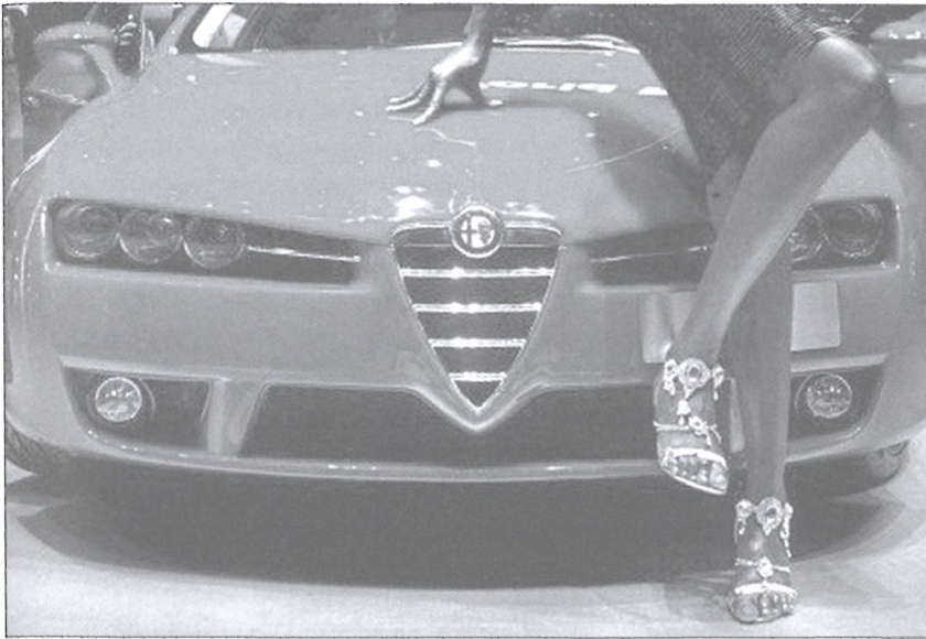
Genf, mint technológiai központ: az autósalon

Térjünk vissza a kutatáshoz. Mi történt az eredmények fényében? Mondjuk lett egy új országszlogen, ahogy sok country branding program esetében?