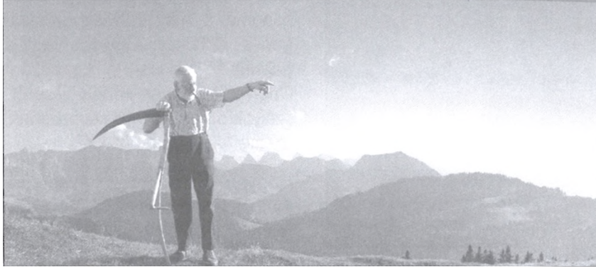
Get Natural – a svájci „turizmus rt.” kampánya

csak egy szelet, a kultúra csak egy szelet, a külpolitika csak egy szelet, és így tovább. Ezekből a szeletekből áll össze a teljes „születésnap tortája”. A mi feladatunk, hogy ez a torta minél egységesebb legyen, tehát alapvetően stratégiai koordinációt végzünk, pontosabban javaslatokat teszünk azoknak a szervezeteknek, amelyek a turizmusért, a külföldi tőkebefektetésekért, vagy éppen a svájci termékek reklámozásáért felelnek. Sőt, ezeket a javaslatokat voltaképp ők maguk teszik, a Presence Switzerland leginkább egy cég igazgatóságához hasonlít, amiben ott ülnek az egyes területek képviselői és közösen alakítjuk ki a stratégiát. Utána viszont a szervezeteknek megvan az operatív szabadsága, a saját költségvetése, stb., mi csak a branding keretét adjuk.