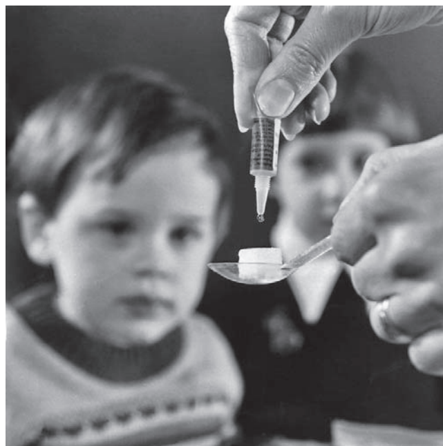
2. kép: A Sabin-csepp beadása kockacukorral.

szállítását is szabályozni kellett: „A Minisztérium rendelete értelmében a járványos gyermekbénulásban megbetegedettek elhelyezésére a megye /a megyei jogú város/ területén megfelelő kórházat kell kijelölni. ... A Minisztérium különös súlyt helyez arra, hogy Budapestre, fertőző betegszállítás kellő indokkal és előzetes helybiztosítással történjék. Erre a mentőállomások különös gondot fordítsanak.” 22 A légzésparalízises fertőzöttek továbbra is kiemelt helyzetben voltak: „Légzébénulással fenyegető eseteknél lehetőség szerint az Országos Mentőszolgálat Légi betegszállító tevékenységét kell igénybe venni. ...” 23