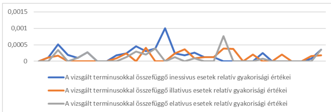
3. ábra: A belső helyviszony jelölésével összefüggő terminusok relatív gyakorisági eloszlásai a korpuszban a 30 napos vizsgálati időszak alatt

Mivel tanulmányunk terjedelmi korlátai miatt nem tudunk kitérni a vizsgált terminusok és a hozzájuk kapcsolódó térjelölések mélyebb vizsgálatára, ezért az Összefoglalás előtt egy grafikonnal szemléltetjük a szóban forgó esetek relatív gyakorisági eloszlásait a korpuszban a 30 napos vizsgálati időszakot tekintve.