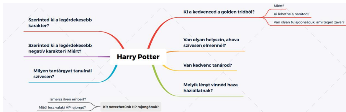
1. ábra A Harry Potter témakör gondolattérképe

A beszélt nyelvi korpusz adatgyűjtésének megtervezésekor az általánosiskolás-korú gyermekeket több korcsoportra osztottuk (6–7, 8–9, 10–11, 12–13, 14–15 évesek), valamint egy felső tagozatos tanulókkal készült felmérés során összegyűjtöttük, majd kiválasztottuk azokat a témaköröket, amelyekről a felvételek során az adatközlőink beszélgetnek. Elsőként a 12–13 éves korosztály tagjaival rögzítettünk videó- és hangfelvételeket. Az adatközlő gyermekek a kiválasztott tizenkét témakörrel – állatok, influenzaszerek, Harry Potter, kirándulás, kreatív hobbi, kutyák, technológia, természet, saját történet / régi emlék, sorozatok, sport, utazás – készített gondolattérképek alapján beszélgetnek egymással.