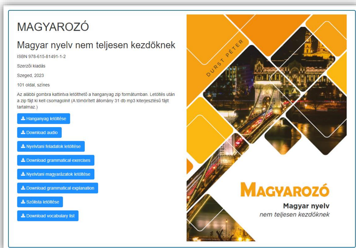
2. ábra: A www.magyarozo.hu weboldal folyamatosan bővülő felülete

A tananyaghoz készült egy önálló weboldal is ( www.magyarozo.hu ), ahonnan ingyenesen letölthetőek további kiegészítő anyagok. Az oldalon már a kötet megjelenésekor megtalálható volt a könyv teljes hanganyaga. Az angol nyelvű nyelvtani magyarázatok, a kiegészítő grammatikai feladatok, a gyakorlókönyv feladatainak megoldókulcsa és a könyv fejezeteihez tartozó szólisták folyamatosan készülnek és kerülnek fel az egyszerűen elérhető, logikusan felépített weboldalra (2. ábra). A könyv hátsó borítóján az ezekkel kapcsolatos fontos információk angol és magyar nyelven is megtalálhatóak.