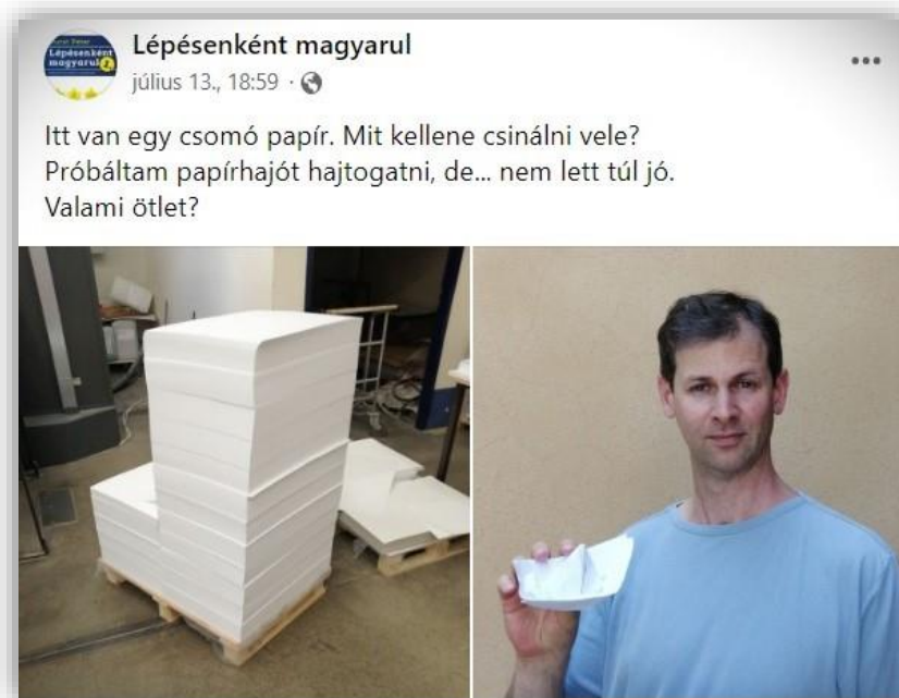
3. ábra: A kötet megjelenésének folyamatát a Lépésenként magyarul közösségi oldalain is nyomom követhették az érdeklődők

jegyzék két oldalra került (4–5. oldal): ebben a fejezetek oldalszáma mellett négy oszlopban szerepelnek a könyvben előkerülő témák és nyelvi jelenségek.