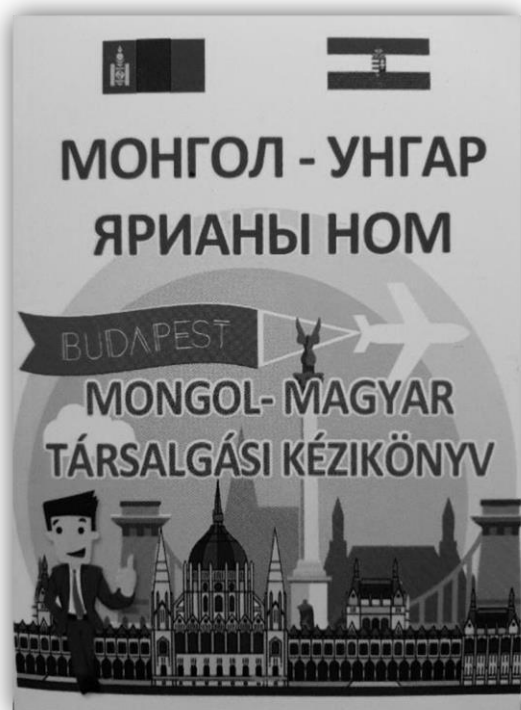
1. ábra: A kézikönyv borítója (saját fotó)

A kezdő szintet „igazolja”, hogy a könyv elején megtalálható a magyar ábécé (3. ábra), amely azonban olyan ritka, messze nem az alapszókinszbe tartozó szavakat tartalmaz, mint pl. ördög, csacsi, ihlet, szász vagy tat . Nehézséget okoz az IPA átírási rendszer használata is, mert nem feltétlenül ismeri mindenki. Szintén problémásak azonban a kiejtést segítő átíratok is: pl. mivel a mongolban nincs a magyar a -nak megfelelő hang, a szerzők következetesen az o hangot javasolják helyette (pl. alma [olmo], agg [ogg]). 10