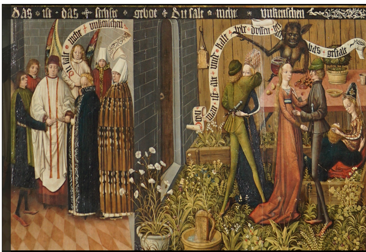
Abbildung 3: 6. Gebot. Marienkirche Danzig (Gdansk), unbekannter Künstler, Ende 15. Jahrhundert 4

Das erste Exempel (Abbildung 3) zum sechsten Gebot über die Unkeuschheit zeigt den einzig zulässigen Weg zur Sexualität, die Eheschließung. Der mit Schuld beladene Weg ist hingegen im rechten Bildteil deutlich gemacht, sowohl was die Handlungen betrifft als auch deren Schuldhaftigkeit durch den auf das Spruchband weisenden Teufel.