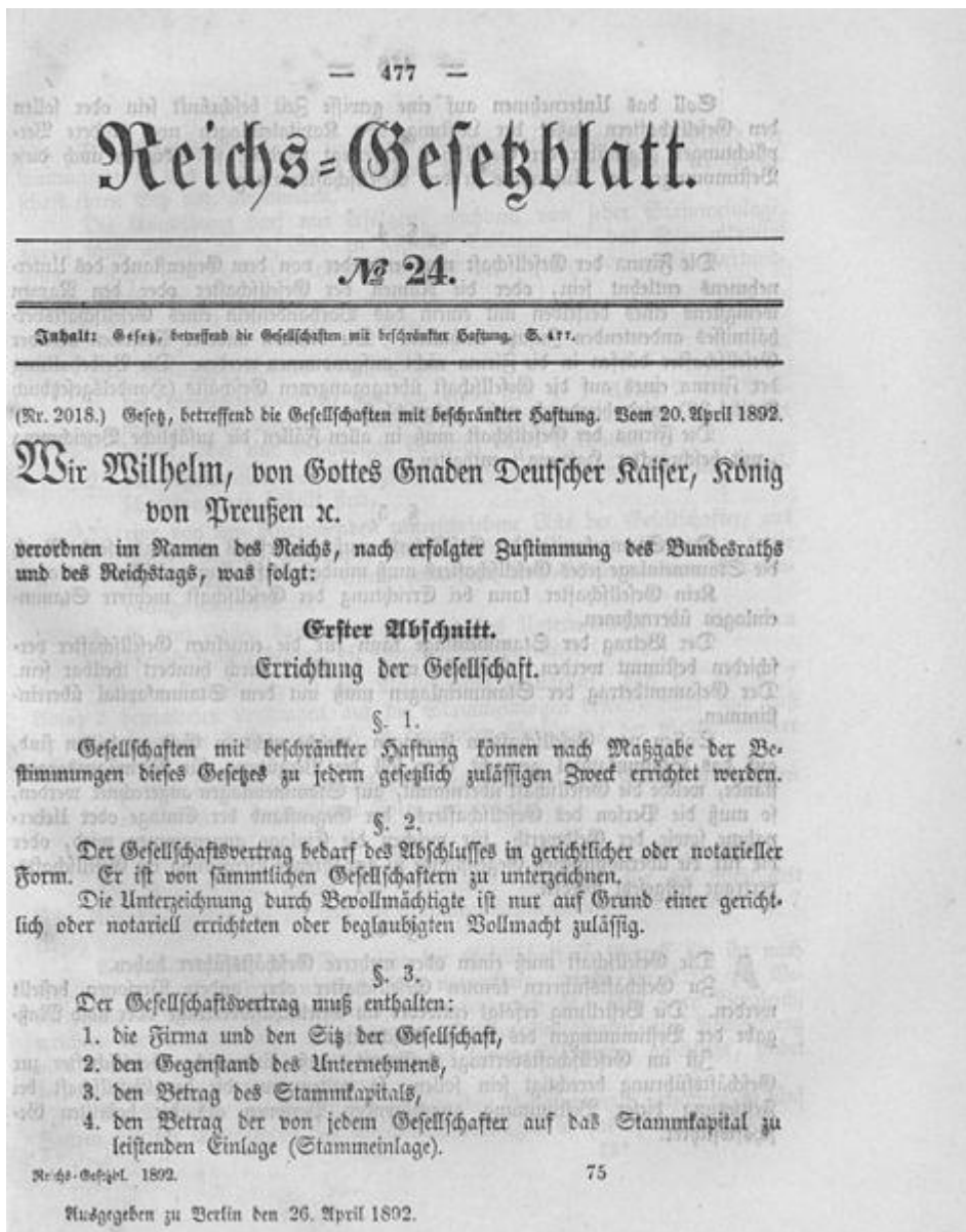
1. kép: Az 1892. május 10-i GmbH-törvény 1. oldala 43

szerint a tervezet az európai jogi transfer egyik korai példája 39 lehetett volna, azonban a kormány támogatása hiányában még parlamenti vitára sem bocsájtották. 40