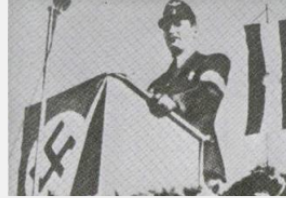
Volksgruppenführer Franz Anton Basch (1940)