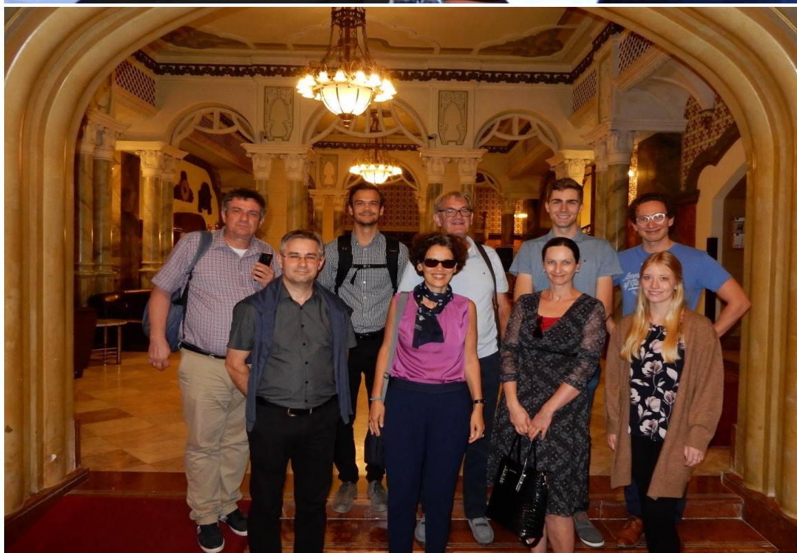
1–2. kép: Pécs, 2019. szeptember 3–4.