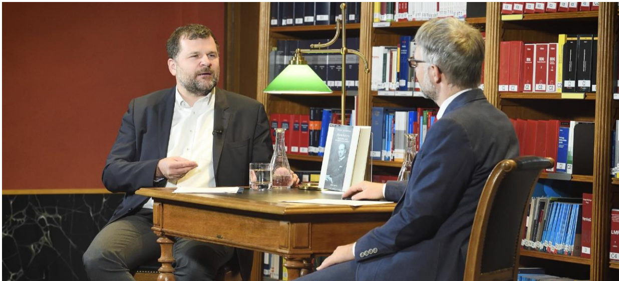
1. kép: A Kelsen -életrajz első bemutatója 2020. október 13-án Bécsben, a Parlamenti Könyvtárban

„Egy életrajzi mű megírásához feltétlenül szükség van arra, hogy a szerző empátiát érezzen afelé, akinek életét a bölcsőtől a sírig, minden részlete kiterjedően végigkíséri” – fogalmazott Thomas Olechowski , a Bécsi Egyetem professzora, 2 az Osztrák Tudományos Akadémia Jogtörténeti Bizottsága elnöke és a Beiträge zur Rechtsgeschichte Österreichs 3 című folyóirat szerkesztője, 2021. január 19-én Bécsben a Városháza könyvtárában ( Wienbibliothek im Rathaus ) tartott könyvbemutatón, melyet a covid-járvány következtében online kísérhetett figyelemmel a szakmai közönség. Ennek a formának sok hátránya, de kétségen kívül egy előnye is van: nem kellett Bécsbe utaznom ahhoz, hogy a rendezvényen részt vegyek. Igaz, sem nekem, sem másnak nem volt lehetőségünk arra, hogy kérdést fogalmazzunk meg. Mégis számos olyan szempont előkerült a szerző és partnere beszélgetése során, melyek rávilágítottak az életrajzírás nehézségeire és szépségeire is.