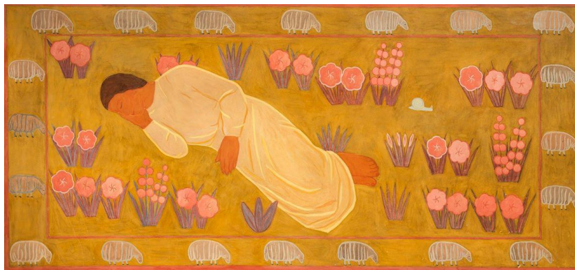
5. kép: Ferenczy Noémi: Alvó pásztor

A szimbólumokra építő coaching számára kimeríthetetlen, minden éjjel tudattalanul és spontán módon megtelő kincsesárát jelentenek az álmok. Az álmok a jelen, a múlt és a jövő problémáit és végső soron megoldásait tárják elénk. 89 Az álom egészséges működésünk záloga, gyógyító ereje meg is sokszorozható, ha tudatos szinten is foglalkozunk vele. A tudatos foglalkozás egyik lehetséges színtere a coaching . Az álom, akár szóba kerül coaching során, akár nem, jelen van az ügyfél nappalaiban (pontosabban éjszakáiban) így annak tartalma jelen van a beszélgetéseken. Itt szeretném megjegyezni, hogy a coaching klasszikus és jól bevált vizualitásra építő módszerei (a