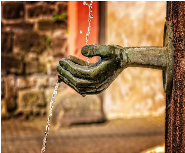
3. kép: Ivókút

A coaching során használt képek (pl. Dixit, vagy saját készítésű kártyák) tartalma személyes szimbólum szintjére emelkedhet, jelentéssel telhet meg. A képek, akár az útjelző táblák, segítenek jobban eligazodni az ügyfél világában. Vezetnek, mutatják, hogy hol vannak a lényeges pontok, amerre érdemes továbblépni. A velük való munka a szinkronicitás elvén működik, azt a jelentést olvassuk ki belőlük, ami az adott pillanatban üzenetet hordoz egy helyzet megértéséhez. 66 Hasonló működési elven alapszik, amikor a képek helyett tárgyak közül választunk. 67