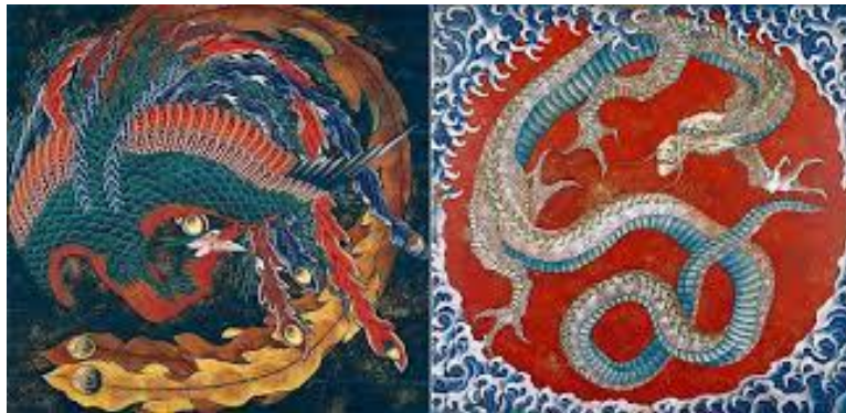
2. kép: Hokusai: Főnix és Sárkány motívum