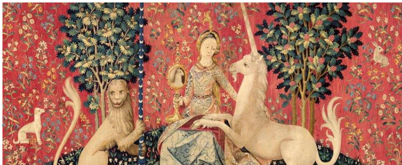
1. kép: A hölgy egyszarvúval

többek között olyan területekre invitálva az olvasót, mint a képek, az alkotás, a mese és az álom világa.