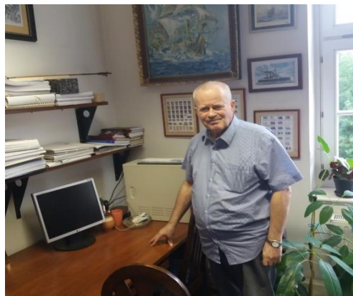
A tanszéken (2019)