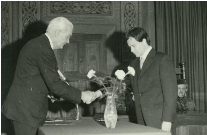
Sub auspiciis Rei Publicae Popularis doktori avatás (1978)

Pályafutása alatt számos kitüntetést kapott munkája elismeréséért. Amikor befejezte az egyetemet, akkor Sub auspiciis Rei Publicae Popularis doktorként avatták. Ez nagy szó volt az egyetemen!