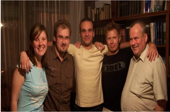
A matrózok: tanítványokból barátok lettek (2005)