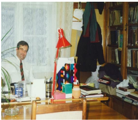
A tanszéken (1992)