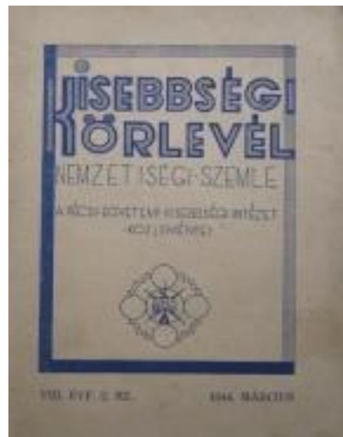
2. kép: A kisebbségi magyar irodalmi Láthatár (1933 – 1944) és a Pécsi Egyetemi Kisebbségi Intézet közleményeit tartalmazó Kisebbségi Körlevél (1942)