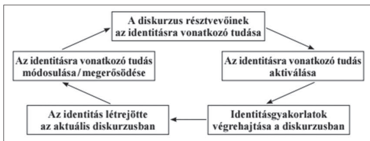
1. ábra: Az identitás kialakulásának körfolyamata Petykó alapján

sok mentális feldolgozásának eredményeként rögzülő identitásként. 10 Az identitás kialakítása a diskurzusban olyan dinamikus körfolyamat, amelyben fontos szerepet kap a diskurzusközösség tagjainak az adott identitásra vonatkozó tudása. Ez a körfolyamat öt összetevőből áll: 1) a diskurzus résztvevőinek az identitásra vonatkozó tudása; 2) az identitásra vonatkozó tudás aktiválása; 3) identitásgyakorlatok végrehajtása a diskurzusban; 4) az identitás létrejötte az aktuális diskurzusban; 5) az identitásra vonatkozó tudás módosulása/megerősödése. Petykó 11 ábrája (1. ábra) az összetevők közötti viszonyokat szemlélteti: